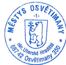
Aleš Pfeffer starosta městyse Osvětímány

Obřadní síň Obecní dům č. 350 687 42 Osvětímány