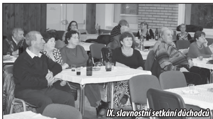
IX. slavnostní setkání důchodců