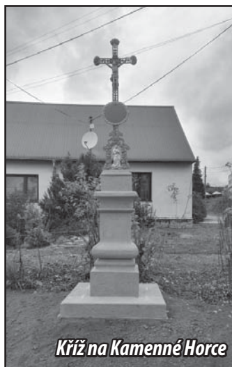
Kříž na Kamenné Horce