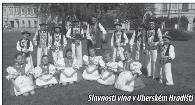
Slavnosti vína v Uherském Hradišti