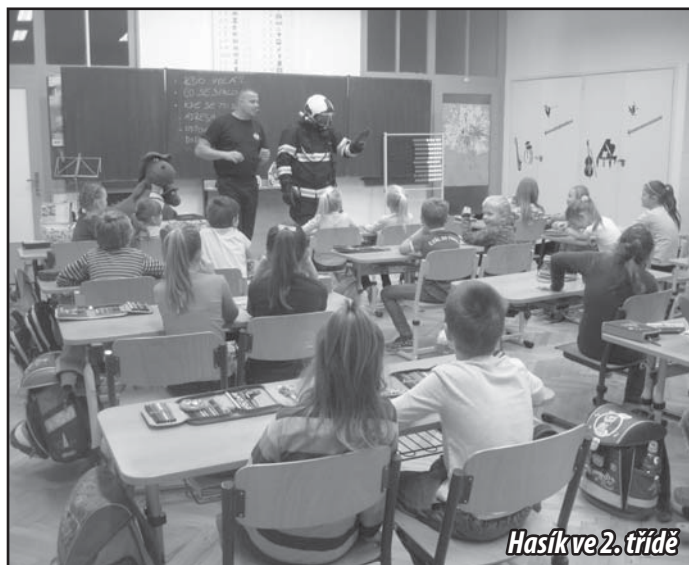
Hasík ve 2. třídě