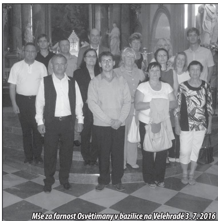
Mše za farnost Osvětimany v bazilice na Velehradě 3. 7. 2016