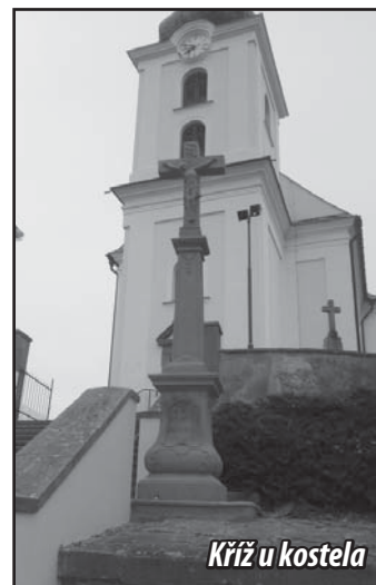
Kříž u kostela

Připravuje se také obnova památkově chráněného kříže z 19. století, který stával u komunikace z Vřesovic do Osvětiman, na hranici osvětimanského katastru. Na restaurování tohoto kříže bylo již vydáno kladné stanovisko Národního památkového ústavu – územního odborného pracoviště v Kroměříži. Budeme také žádat o finanční podporu z programu Ministerstva kultury - Podpora obnovy kulturních památek prostřednictvím obcí s rozšířenou působností - okresu Uherské Hradiště.