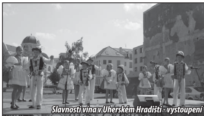
Slavnosti vína v Uherském Hradišti - vystoupení