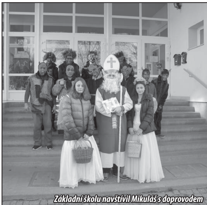
Základní školu navštívil Mikuláš s doprovodem

Člověk je jako pes, to nikdo nezmění, až na to, že nemá očásek k vrtění.