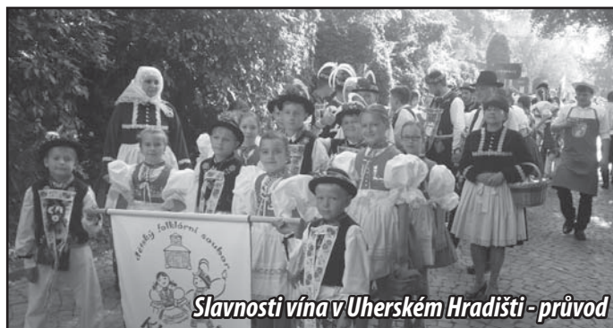
Slavnosti vína v Uherském Hradišti - průvod