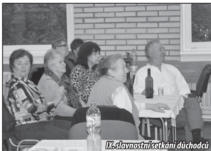
IX. slavnostní setkání důchodců