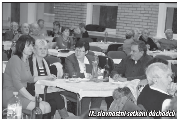
IX. slavnostní setkání důchodců