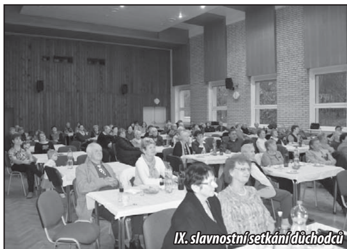
IX. slavnostní setkání důchodců