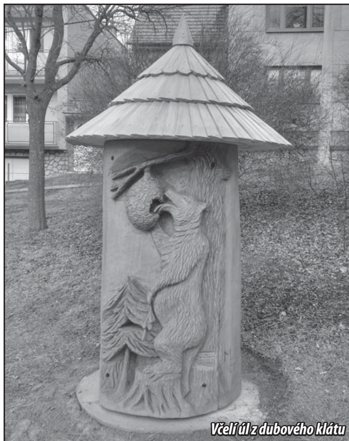
Včelí úl z dubového klátu

Výstupem je zhotovení čtrnácti řezbářsky zpracovaných úlů, jejichž předlohy vychází z vydané knihy Pohádky buchlovských hor, nebo si jednotlivé obce samy navrhovaly námět. Naše obec zvolila námět medvěda jako symbol znaku našeho městyse. Kolečko úlů se stane i naučnou stezkou. Další etapou tohoto projektu bude výroba naučných cedulí, které budou umístěny u těchto úlů. Následně bude vydána brožurka o včelách a včelařství, ve které bude vložen průkaz badatele. Takže děti po splnění návštěvy všech 14 úlů, které jsou opatřeny symboly, překreslí tyto do průkazu badatele a ten pak odevzdají na určeném místě. Odměnou jim bude volný vstup do zdejších atrakcí (Archeoskanzen, Živá voda, Muzeum Podhradí Buchlovice a další místa). Od jara budou v našem úlu i včely, o které se budou starat místní včelaři.