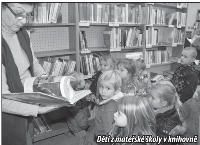
Děti z mateřské školy v knihovně

Pokud budeme hovořit o čtení obecně, pak mi určitě dáte za pravdu, že moderní doba odsunula knížky daleko za tablety, počítače a televizi. Přitom má právě čtení velký vliv na rozvoj řeči, paměti, fantazie i soustředění. To platí nejen pro kategorii žáků školního věku, ale i pro všechny dospělé. Děti, které pravidelně čtou, mají bohatší slovní zásobu, lépe si nové poznatky zapamatují a mají také lepší představivost. Naopak ty, které nečtou, disponují s výrazně omezenou schopností vyjadřovat své myšlenky, mají problémy s komunikací, nebo obtížně chápou psaný text. Děti je potřeba ve čtení podporovat, aby si vytvořily potřebný návyk pravidelně se čtení věnovat. Čas, který rodiče věnují svým dětem tím, že jim předčítají, vysvětlují významy užívaných slov, nechávají je vybrat žánr, významně zvyšuje jejich šance na budoucí uplatnění v zaměstnání i úspěch v soukromém životě. Menší děti mají rády krásné obrázky doplňující text. Rády na knihu sahají, opakovaně si ji prohlíží a