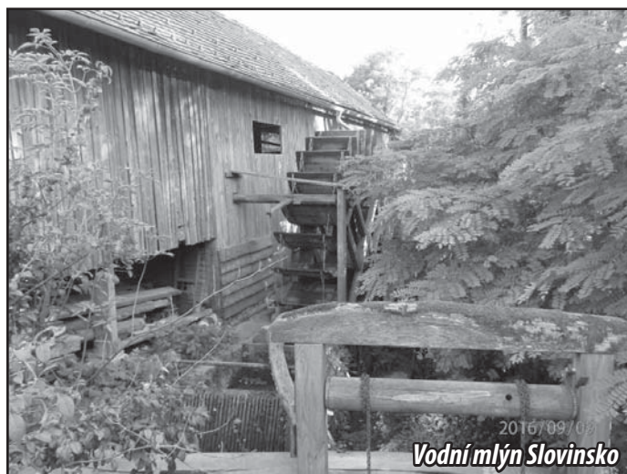
Vodní mlýn Slovinsko