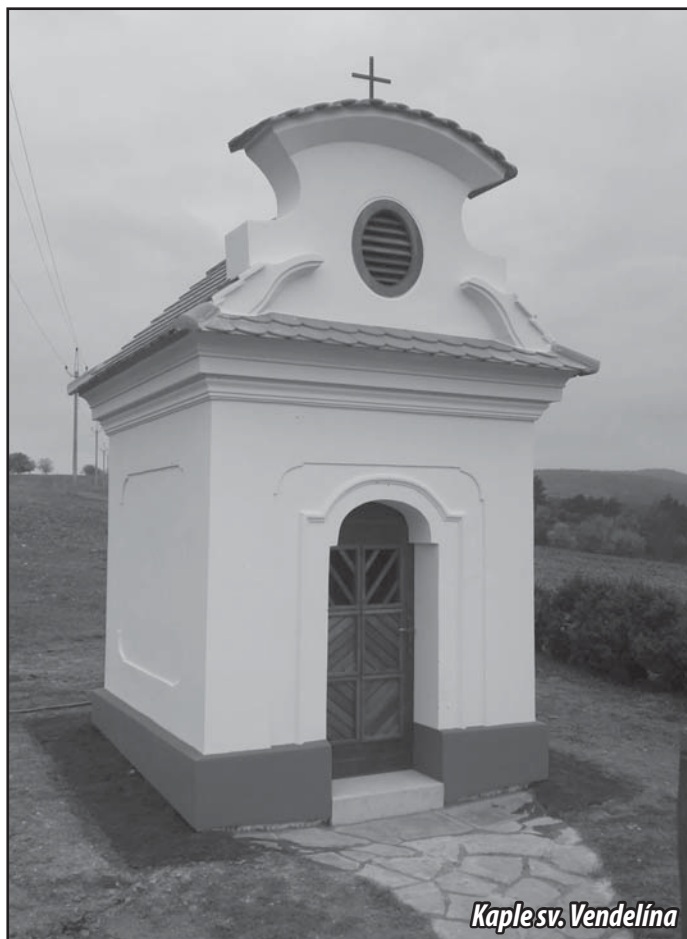
Kaple sv. Vendelína

V rámci pokračující údržby a obnovy kulturních památek v obci jsme z programu Ministerstva kultury ČR „Podpora obnovy kulturních památek prostřednictvím obcí s rozšířenou působností“ pro rok 2016 obdrželi příspěvek na obnovu kulturní památky „kaple sv. Vendelína na pozemku parcela č. 2608 v k. ú. Osvětimany“. Kaple byla zrestaurována, dílo je velmi zdařilé a kaplička doslova září na kopci za obcí.