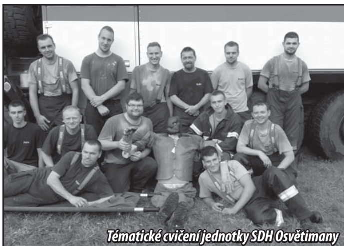
Tématické cvičení jednotky SDH Osvětimany

22. 7. jsme vyjeli k padlému stromu mezi obcemi Medlovice a Stříbrnice, kde byla zlomena velká větev, ohrožující dopravu na pozemní ko-