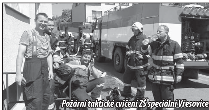
Požární taktické cvičení ZŠ speciální Vřesovice

Blíží se konec roku a se začátkem toho příštího, přesněji 21. 1. 2017, si Vás opět dovolím pozvat na IV. Hasičský bál, kde se, jak pevně věřím, budete perfektně bavit. Připravujeme si pro Vás nové zábavné scénky, šenk i tombolu a v neposlední řadě novou kapelu Fair Play ze Bzence, se kterou nebude o zábavu nouze.