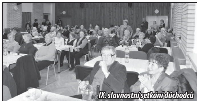
IX. slavnostní setkání důchodců