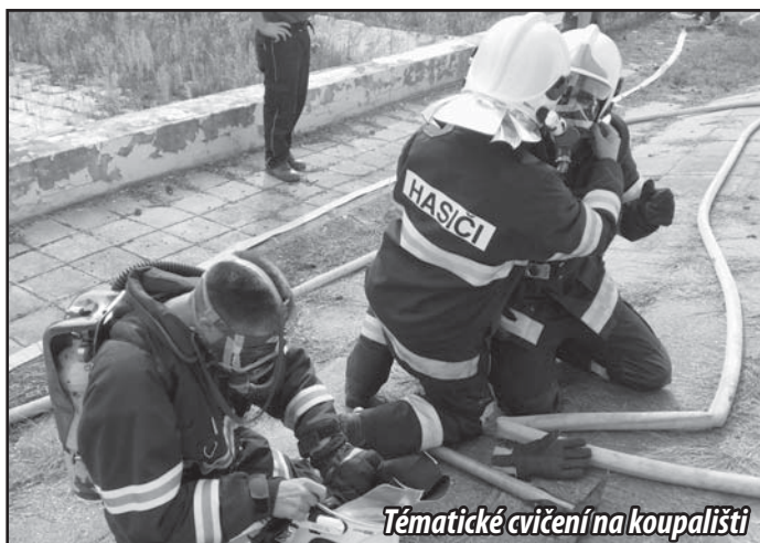
Tématické cvičení na koupališti