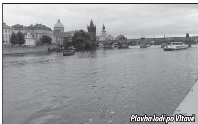
Plavba lodí po Vltavě