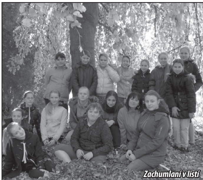
Zachumlání v listí