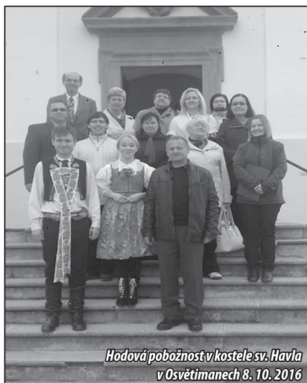
Hodová pobožnost v kostele sv. Havla v Osvětimanech 8. 10. 2016