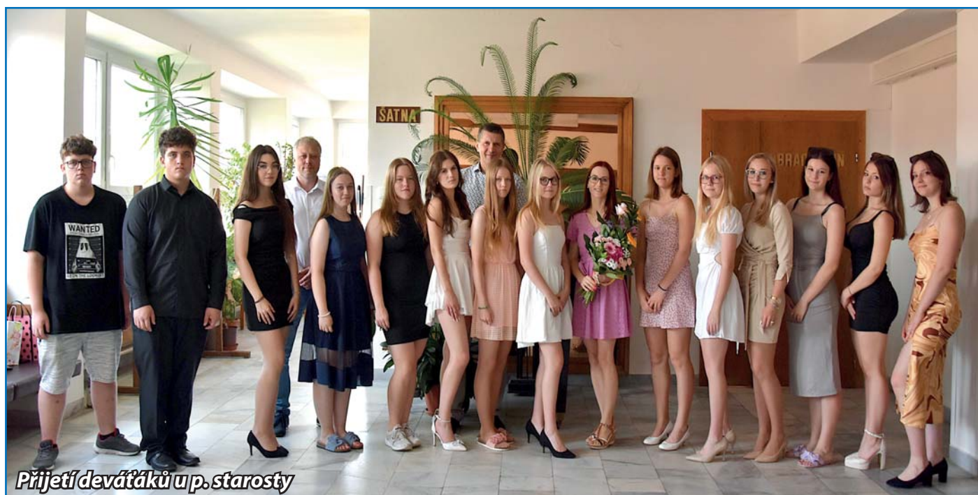
Přijetí devětáček u p. starosty