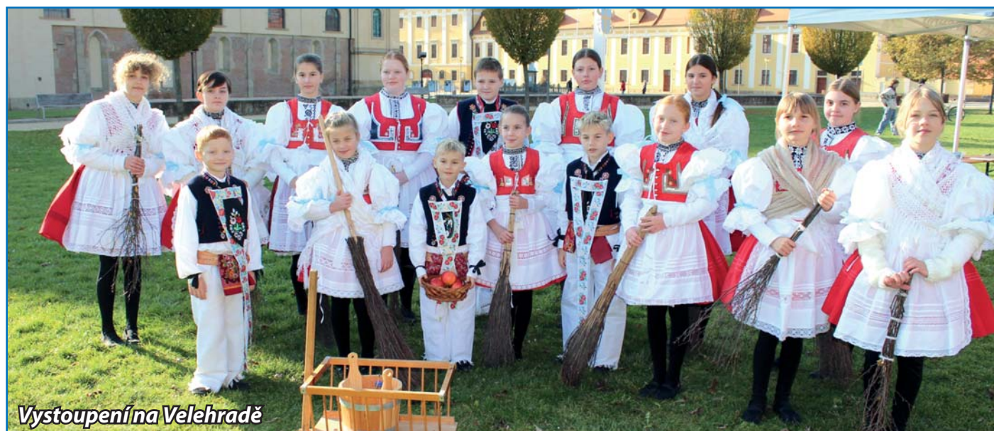
Vystoupení na Velehradě