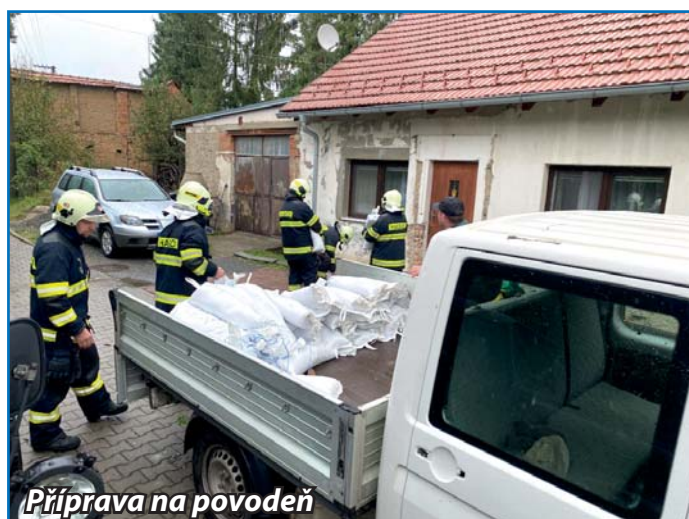
Příprava na povodeň