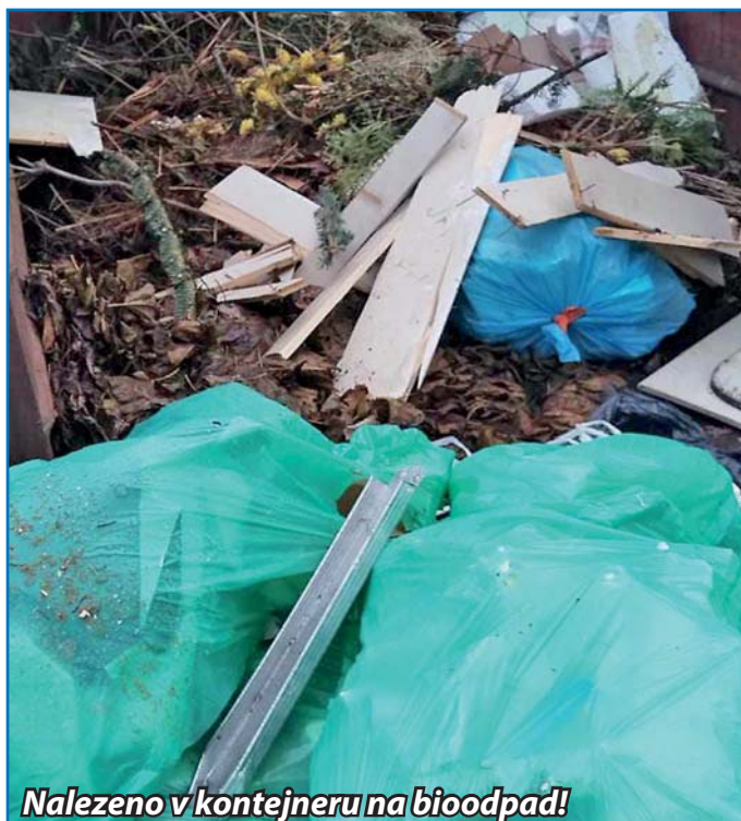
Nalezeno v kontejneru na bioodpad!

Ukládání jakéhokoliv odpadu mimo nádoby k tomu určené je přestupkem, za který občanům hrozí pokuta do výše 50.000 Kč. Při naplnění kontejnerů neodkládejte odpady vedle, ale vyhledejte jiné nádoby v obci nebo vyčkejte, až bude odpad vyprázdněn svozovou firmou. Využívejte Sběrný dvůr v Buchlovicích!