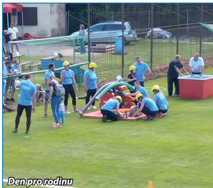
Den pro rodinu

Se začátkem příchodu jara jsme uspořádali velký sanitární den na hasičské zbrojnici, kdy se provedl generální úklid jako každý rok, ale náročnější období se na nás chystalo na konec dubna, v květnu a červnu. První akcí bylo stavění máje na náměstí. Jedná se o každoroční tradici oblíbenou a hojně navštěvovanou obyvateli naší obce. Máj se zdárně postavila a týden se tyčila nad Osvětimany. Následně v noci 5. května zloději z okolí nařezali kmen asi do půlky, proto se z bezpečnostních důvodů máj byla pokácena našimi členy, aby nedošlo k ohrožení.