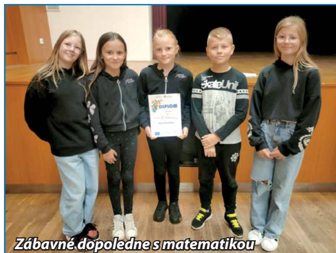
Zábavné dopoledne s matematikou