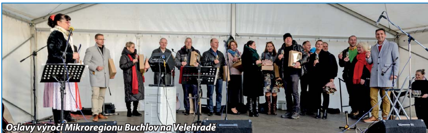
Oslavy výročí Mikroregionu Buchlov na Velehradě