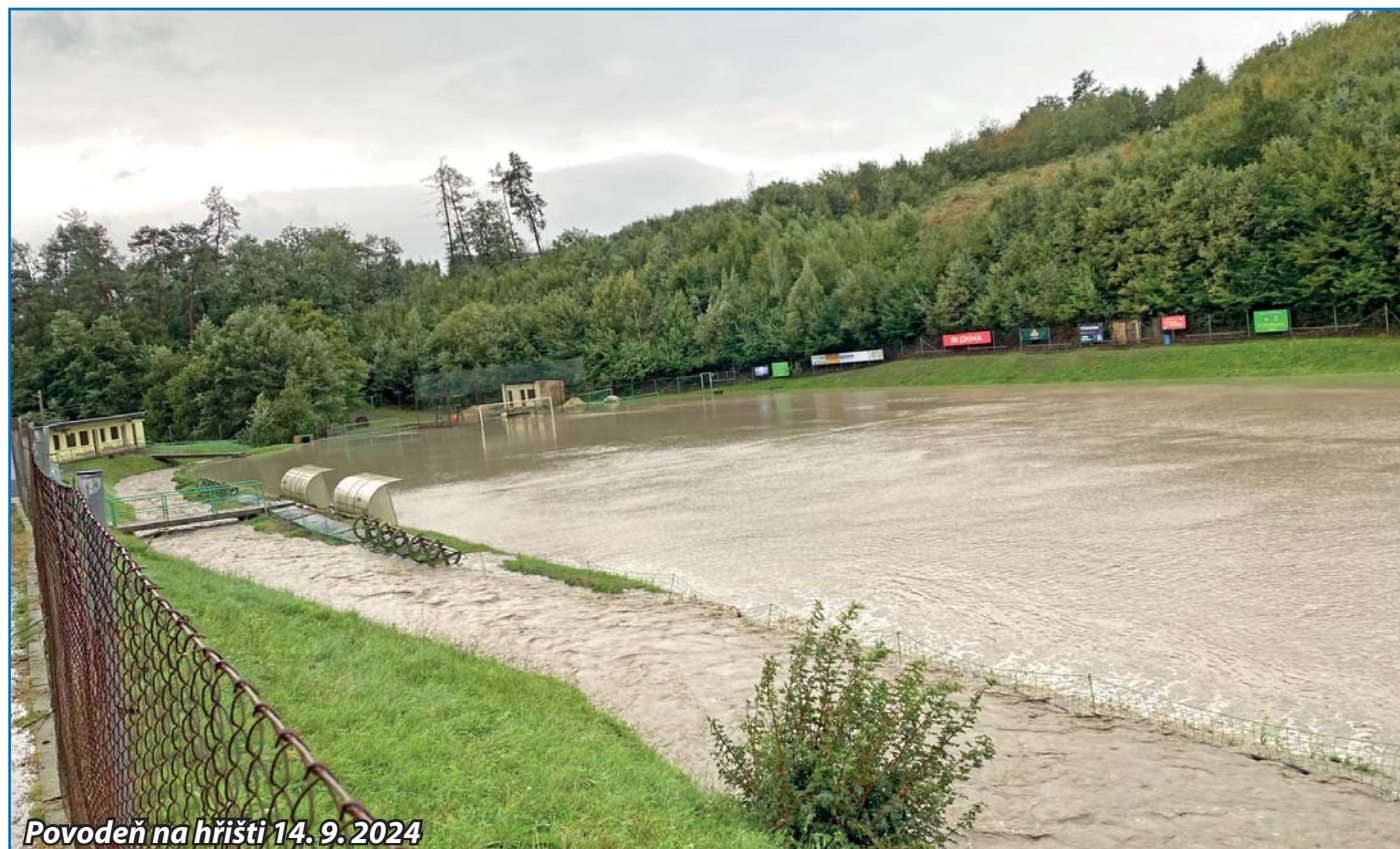
Povodeň na hřišti 14. 9. 2024