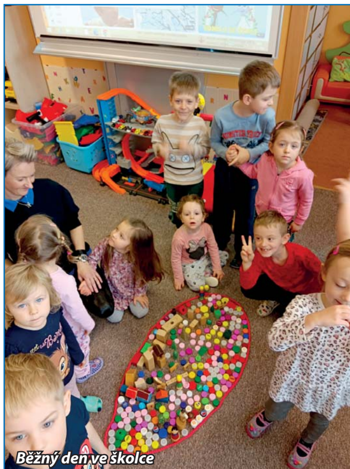
Běžný den ve školce