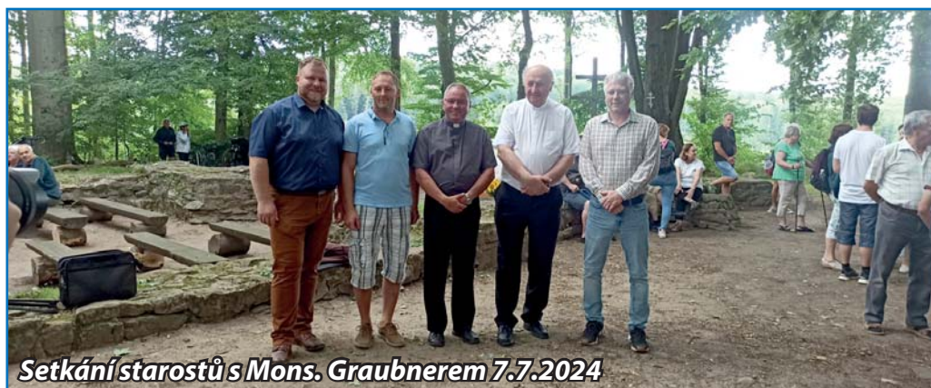
Setkání starostů s Mons. Graubnerem 7.7.2024