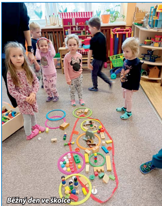
Běžný den ve školce