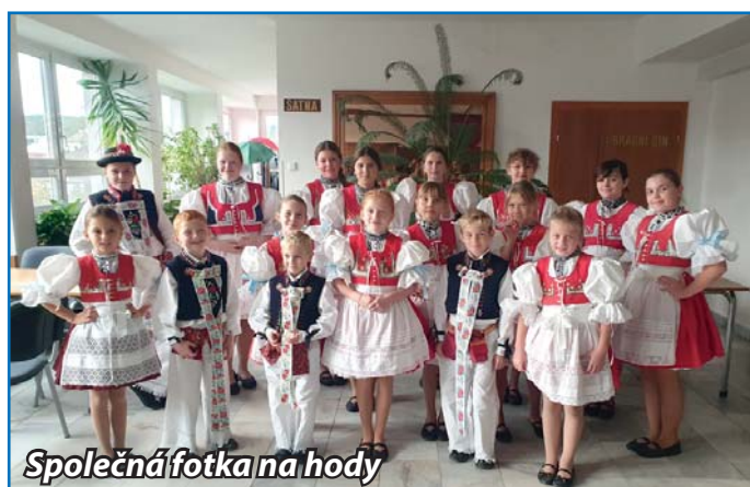
Společná fotka na hody