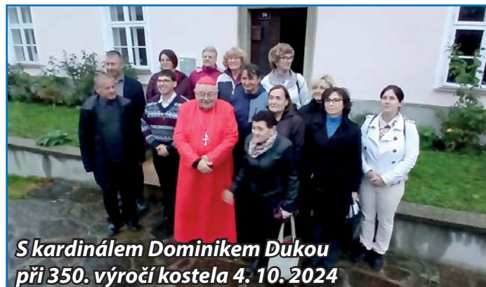
S kardinálem Dominikem Dukou při 350. výročí kostela 4. 10. 2024

V tomto roce ještě zazpíváme 24. 12. na Štědrý den ve farním kostele sv. Havla v Osvětimanech a 26. 12. na slavnosti Narození Páně ve farním kostele sv. Havla.