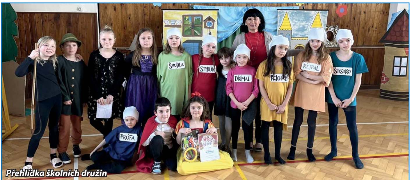
Přehlídka školních družin