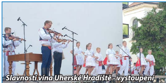
Slavnosti vína Uherské Hradiště - vystoupení