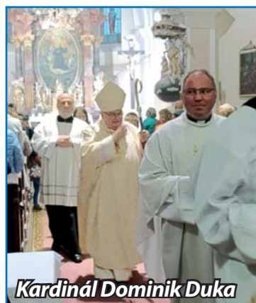
Kardinál Dominik Duka