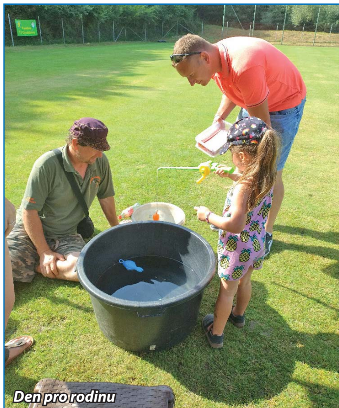
Den pro rodinu