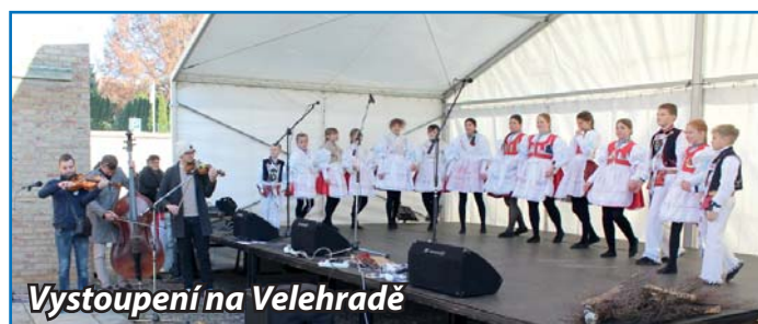
Vystoupení na Velehradě