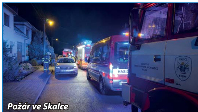
Požár ve Skalce