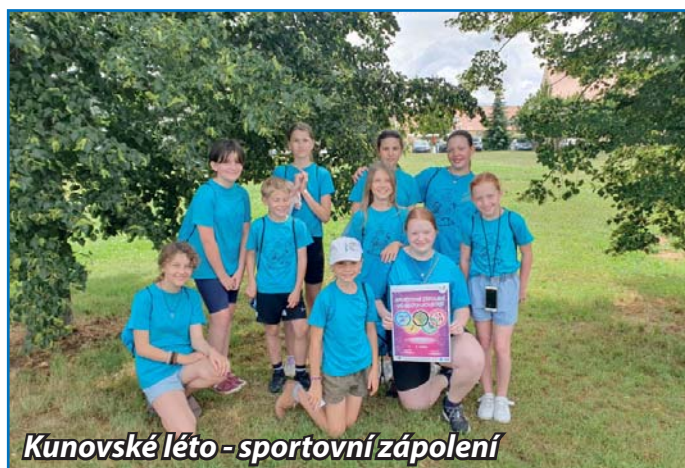
Kunovské léto - sportovní zápolení