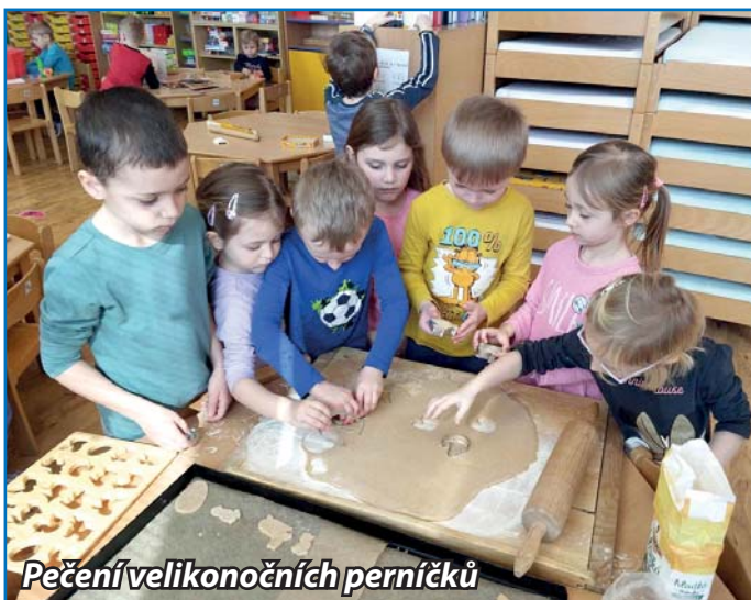
Pečení velikonočních perníčků