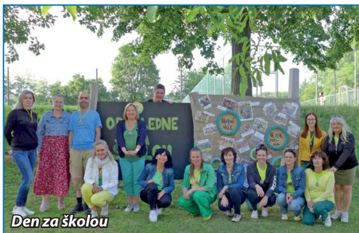
Den za školou