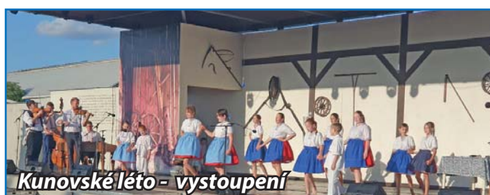
Kunovské léto - vystoupení