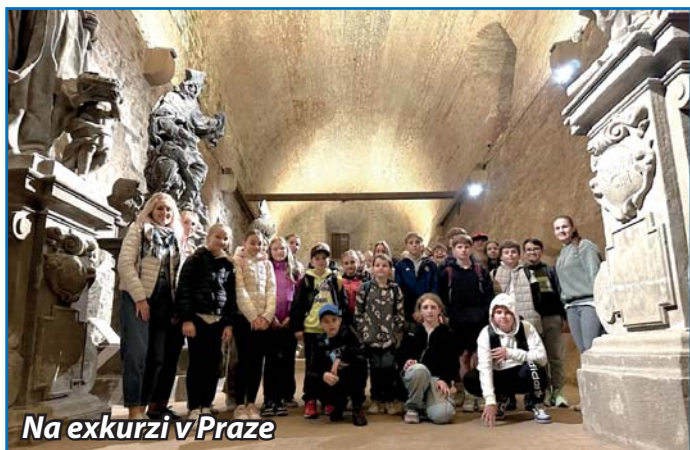
Na exkurzi v Praze