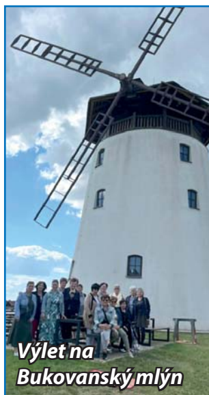
Výlet na Bukovanský mlýn