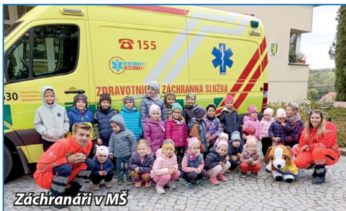
Záchranáři v MŠ