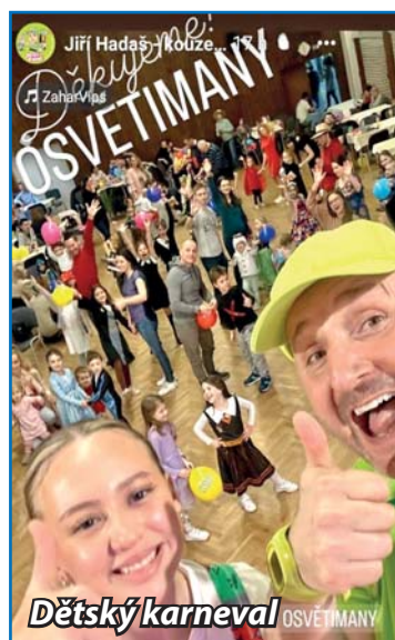
Dětský karneval OSVĚTIMAŇY