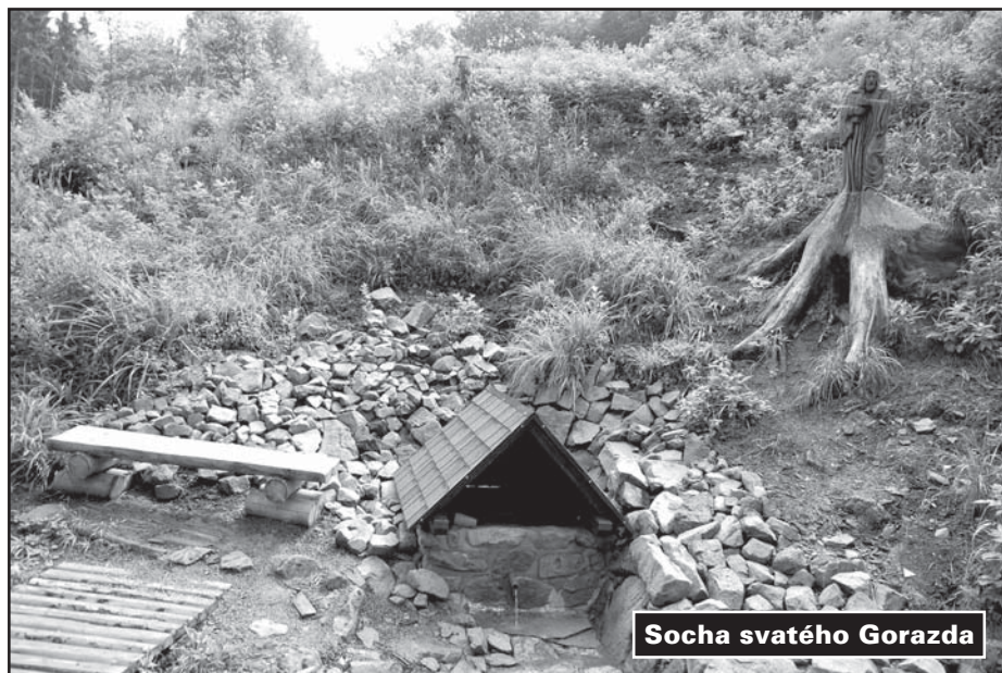
Socha svatého Gorazda