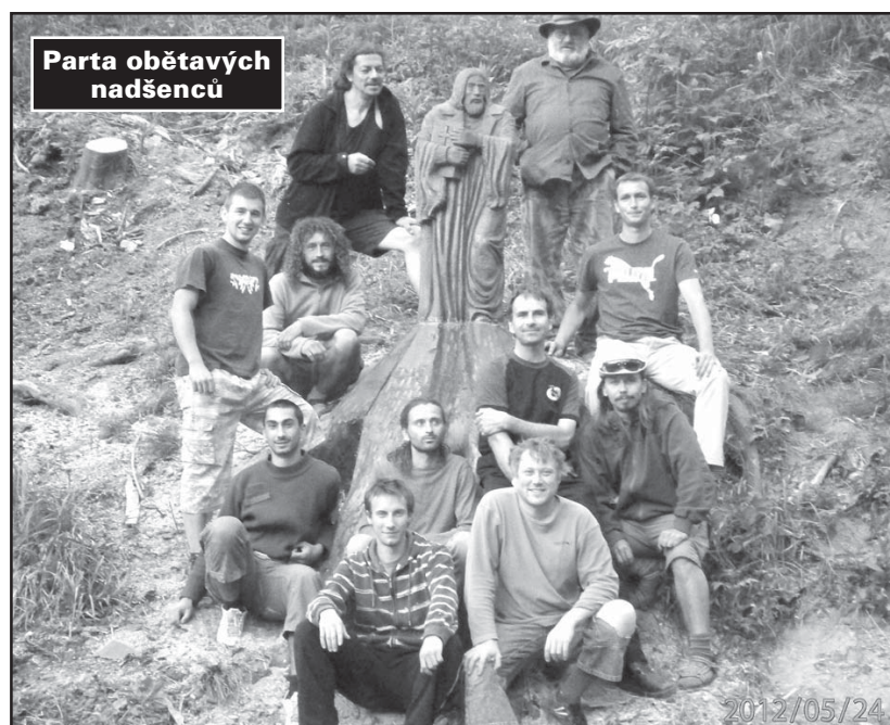
Parta obětavých nadšenců