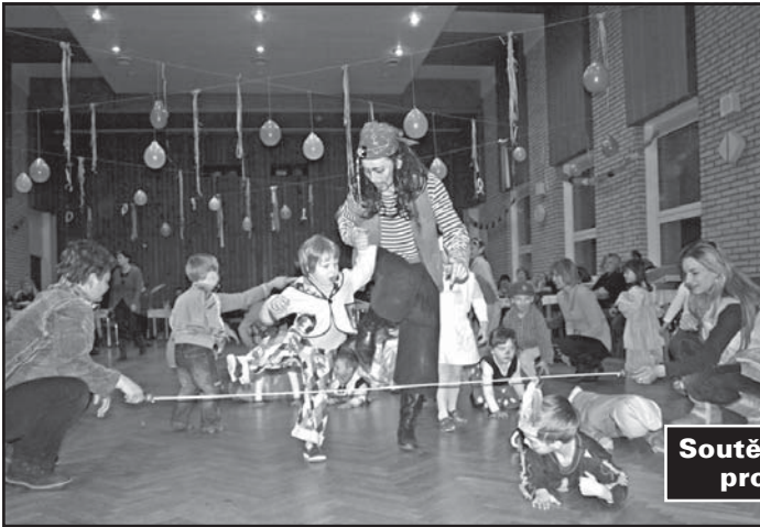
Soutěživé hry pro děti