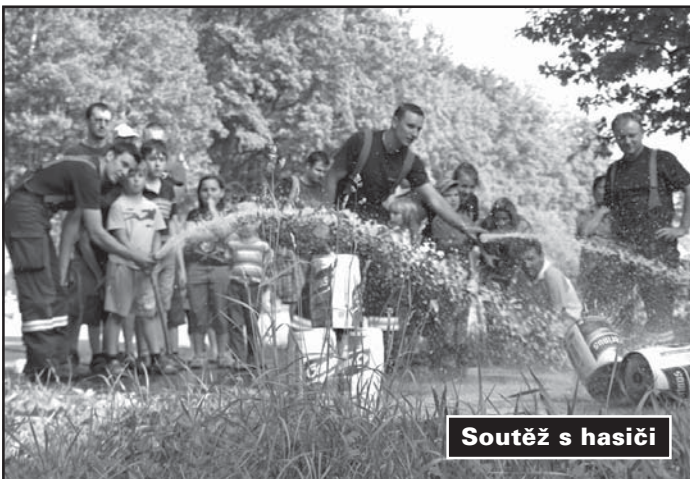
Soutěž s hasiči