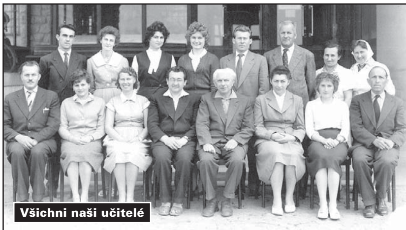
Všichni naši učitelé