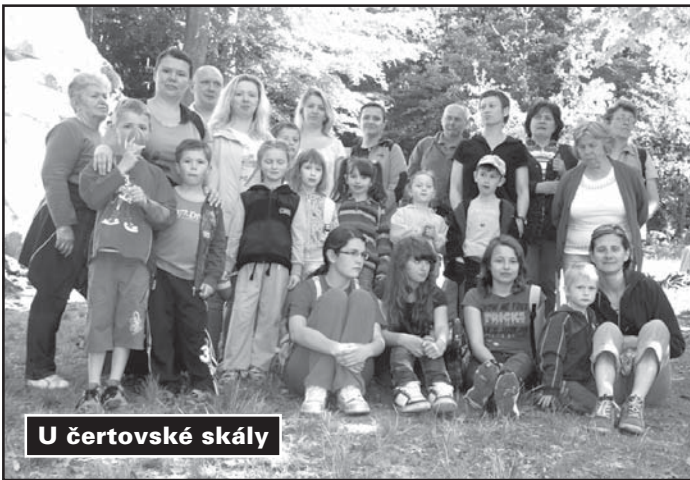
U čertovské skály