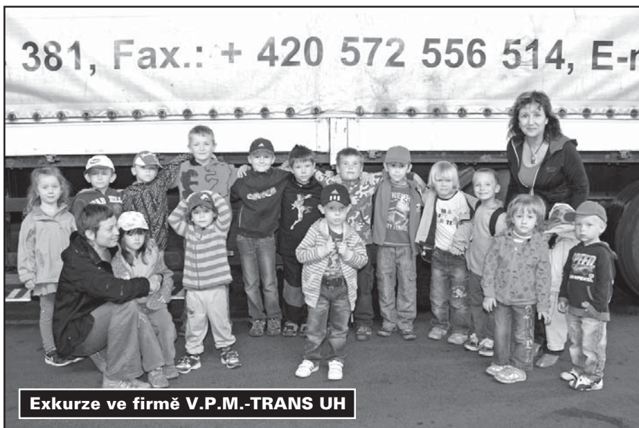
Exkurze ve firmě V.P.M.-TRANS UH

V zimě jsme pomáhali zvířátkům přežít tím, že jsme docházeli ke krmelcům a nosili jim různé dobroty. Také jsme vyprovodili zimu ze vsi a utopili Morenu. Od dubna do června probíhal plavecký výcvik dětí v bazénu ve Vřešovicích. Na jaře se uskutečnila návštěva za mládaty zvířat na hájence. Přivítali jsme pásmem