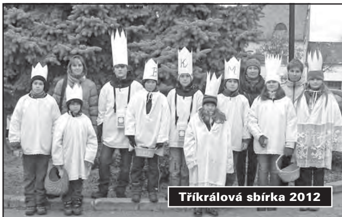
Tříkrálová sbírka 2012