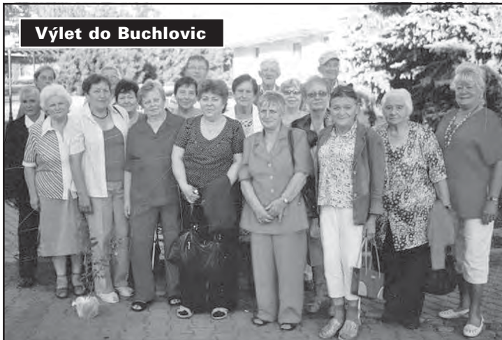
Výlet do Buchlovic