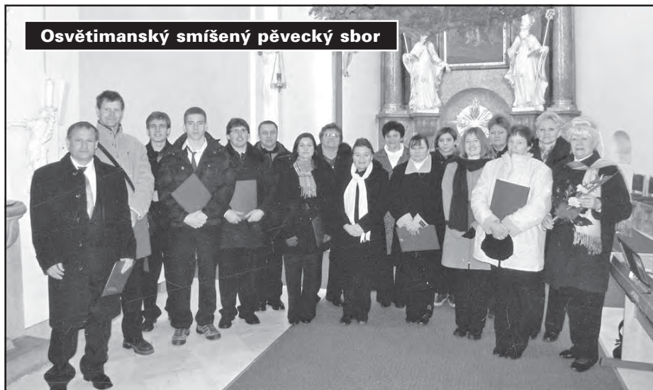
Osvětimanský smíšený pěvecký sbor