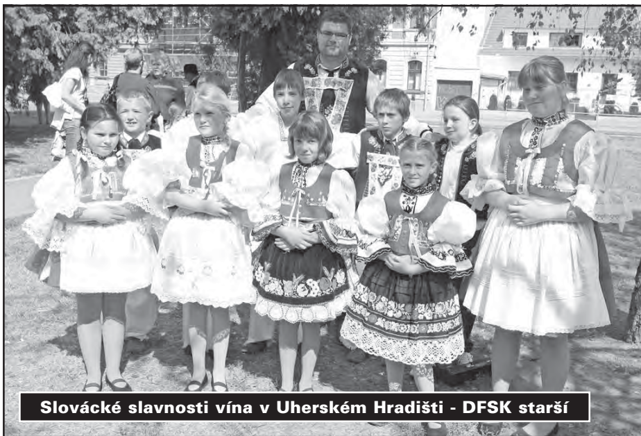
Slovácké slavnosti vína v Uherském Hradišti - DFSK starší