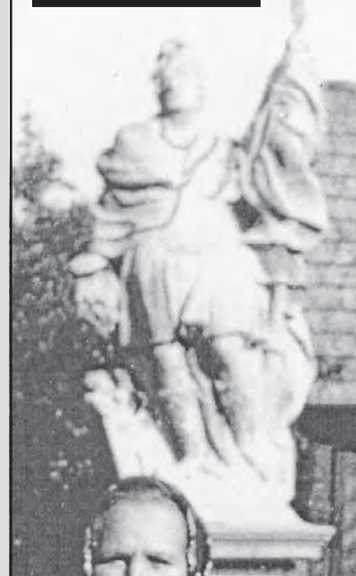
Socha sv. Floriána

Více informací o našem městyse najdete na webových stránkách