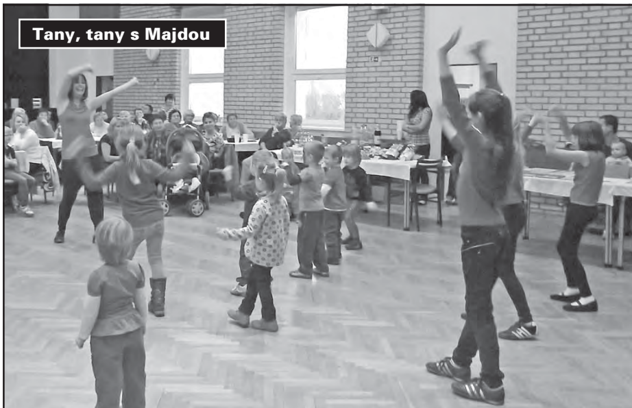
Tany, tany s Majdou