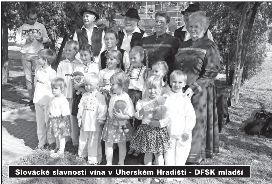
Slovácké slavnosti vína v Uherském Hradišti - DFSK mladší