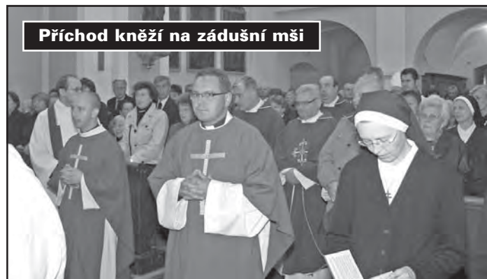
Příchod kněží na zádušní mši