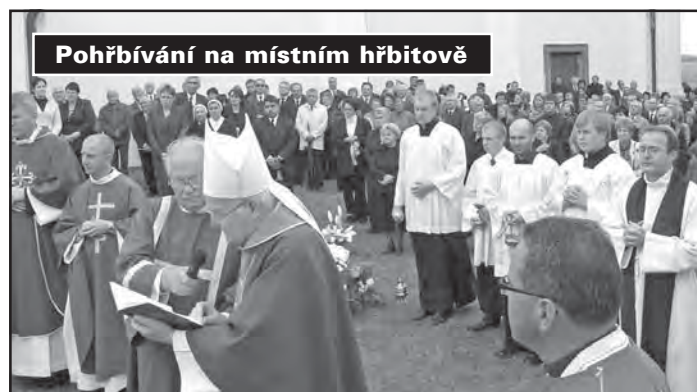
Pohřbívání na místním hřbitově