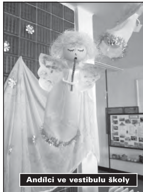
Andílci ve vestibulu školy