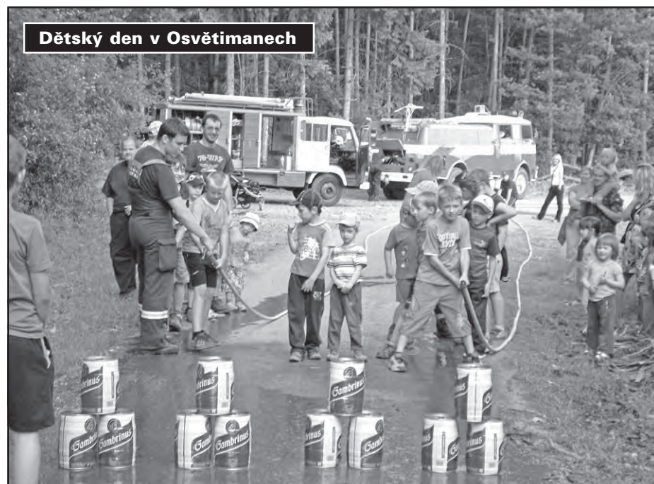
Dětský den v Osvětimanech

Sportovní činnost stejně jako každý rok ani letos nezhálela. Zúčastnili jsme se všech plánovaných soutěží jako např. Noční závody v požárním sportu v Újezdci, Ne-