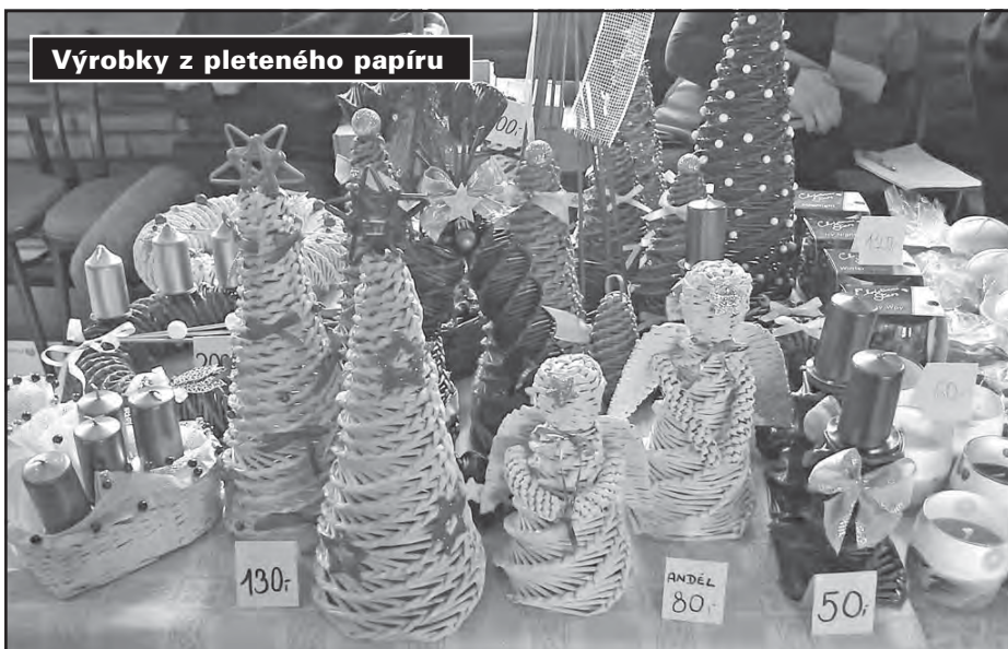
Výrobky z pleteného papíru