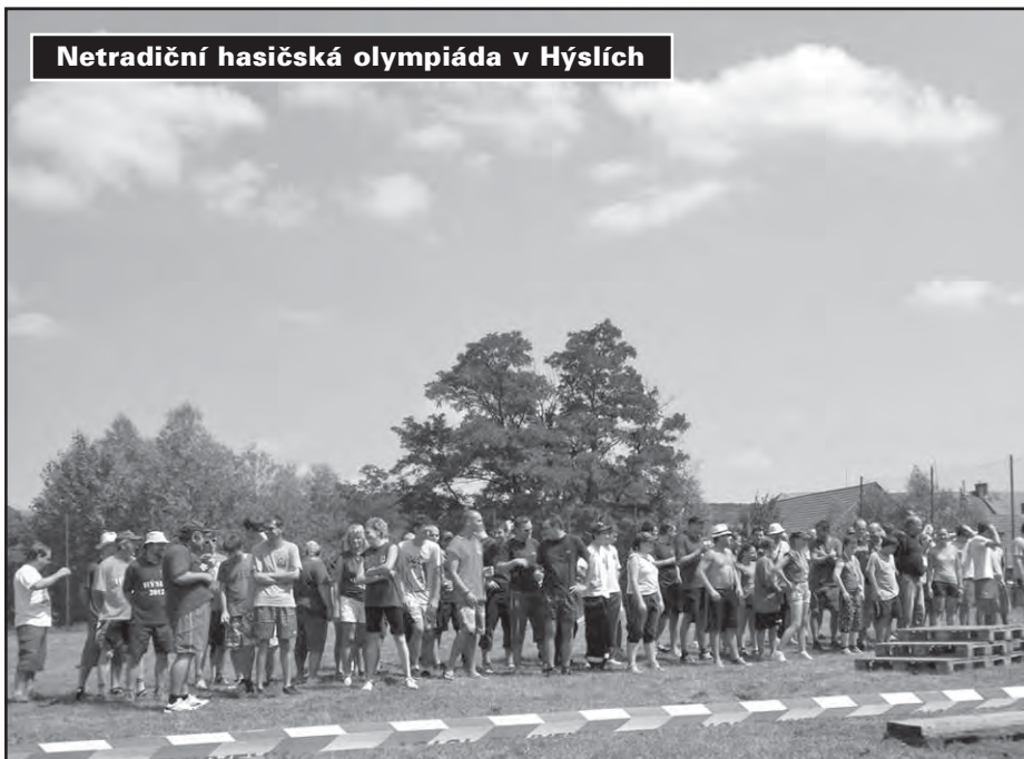
Netradiční hasičská olympiáda v Hýslích

tradiční hasičské olympiády v Hýslích nebo Burčákového turnaje ve Stříbrnicích.