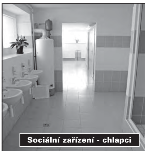
Sociální zařízení - chlapi