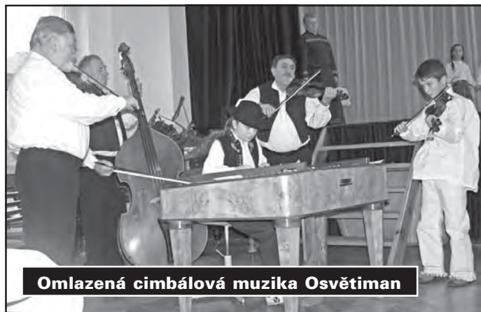
Omlazená cimbálová muzika Osvětiman

S ociální komise se již několik let zaměřuje na péči a pomoc občanům při řešení jejich sociálních problémů, práci charitativní, ale i vzdělávací a společenskou. Shromažďuje požadavky občanů v oblasti sociální, zpracovává je a řeší ve spolupráci s úřadem městyse.