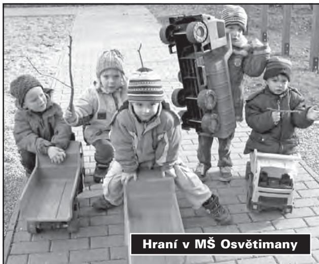
Hraní v MŠ Osvětmany