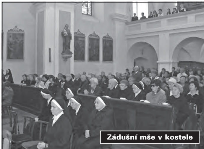
Zádušní mše v kostele