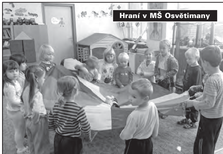
Hraní v MŠ Osvětmany