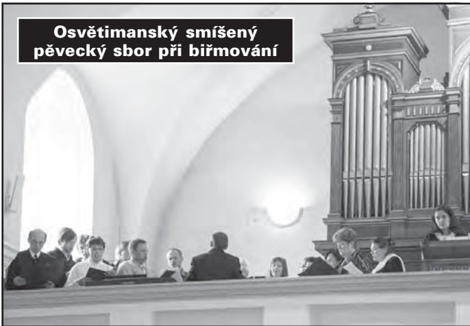
Osvětimanský smíšený pěvecký sbor při biřmování