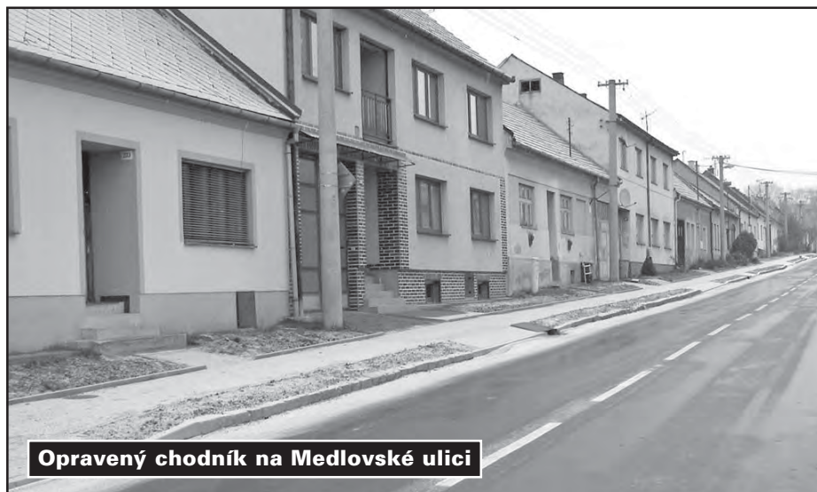
Opravený chodník na Medlovské ulici