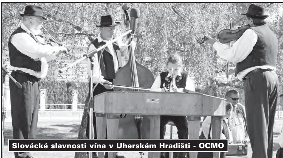
Slovácké slavnosti vína v Uherském Hradišti - OCMO