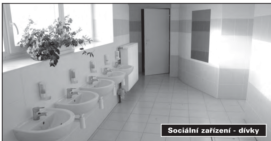
Sociální zařízení - dívky

sbírkou motýlů a vycpaných zvířat. Žáci zažili moc hezké odpoledne.