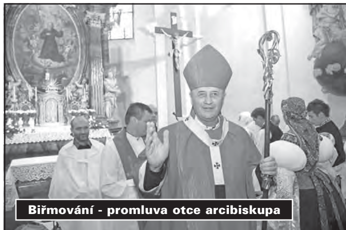
Bířmování - promluva otce arcibiskupa