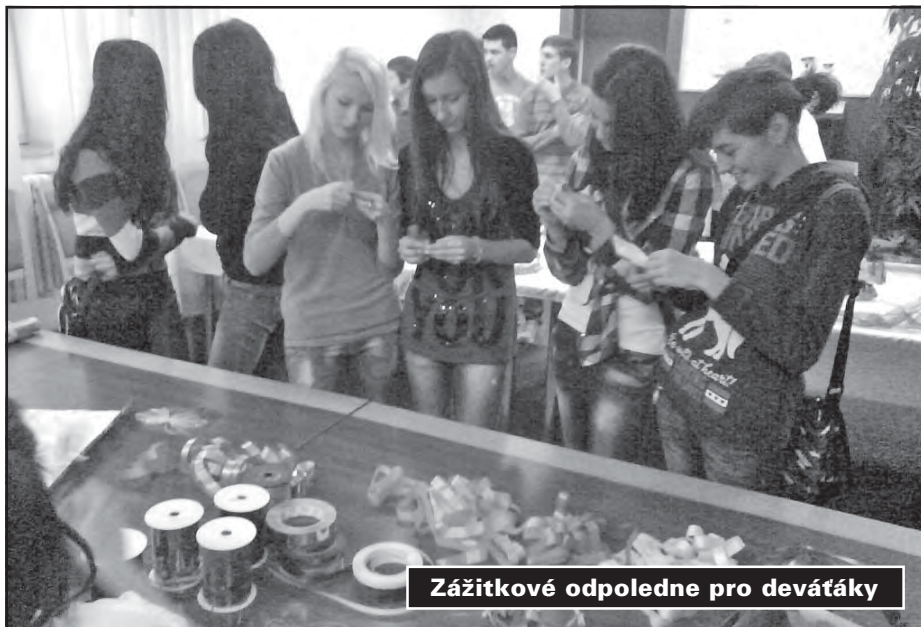
Zážitkové odpoledne pro devěťáky