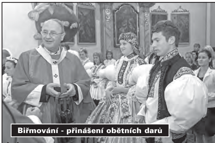
Bířmování - přinášení obětních darů