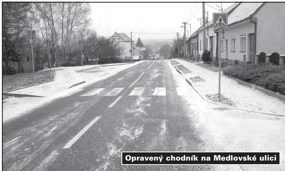
Opravený chodník na Medlovské ulici

Vážený občané, současné zastupitelstvo i já máme polovinu volebního období za sebou. Doposud jsem v tomto příspěvku psal o větších investičních akcích. Chtěl bych proto ještě připomenout, co se nám za dva