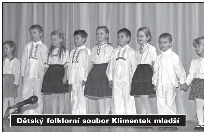
Dětský folklorní soubor Klimentek mladší