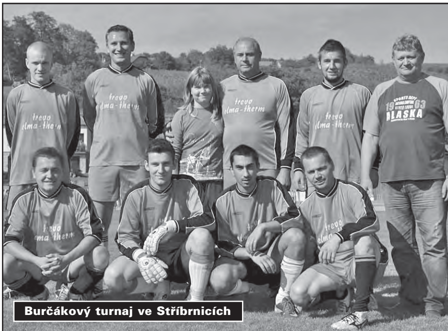
Burčákový turnaj ve Stříbrnicích