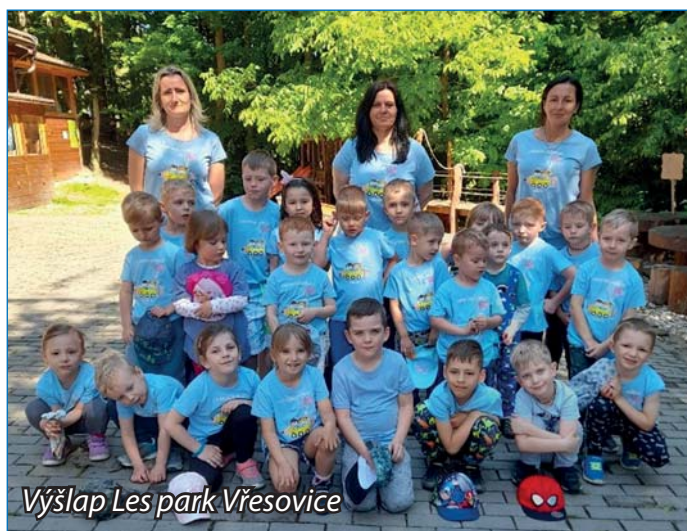
Výšlap Les park Vřesovice