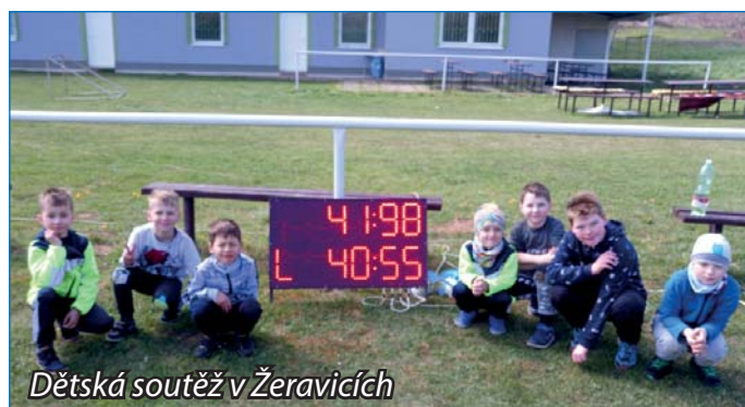
Dětská soutěž v Žeravicích