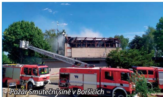
Požár Smuteční síně v Boršicích