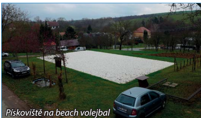
Pískoviště na beach volejbal