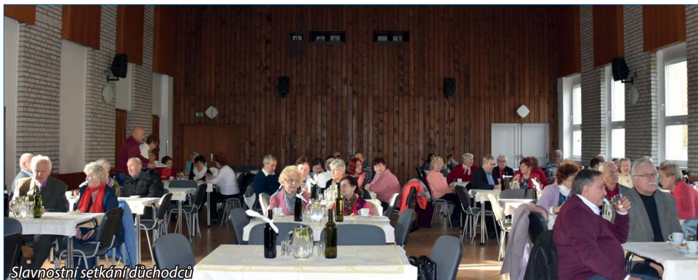
Slavnostní setkání důchodců