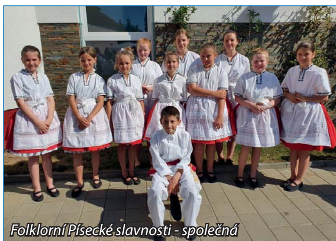
Folklorní Písecké slavnosti - společná