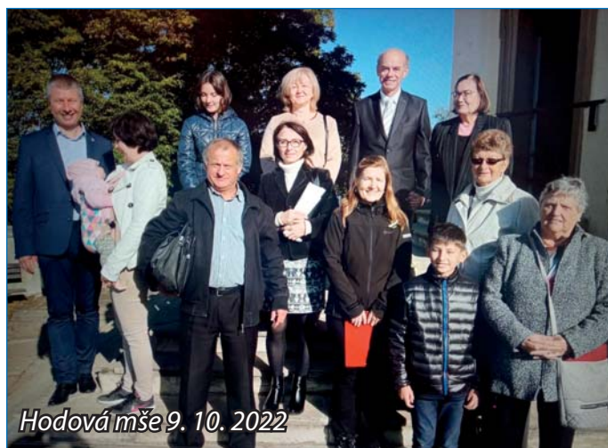
Hodová mše 9. 10. 2022