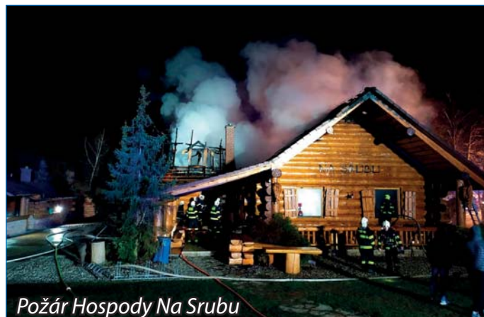
Požár Hospody Na Srubu