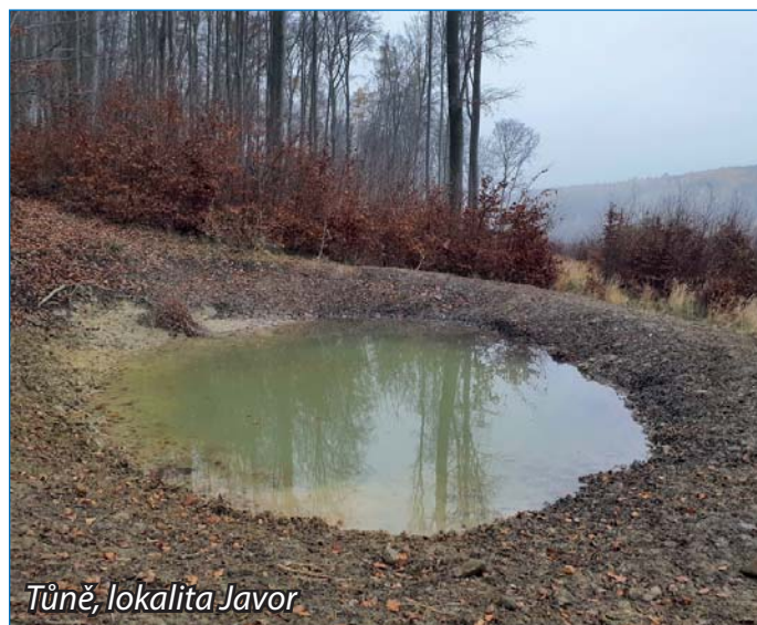
Tůň, lokalita Javor