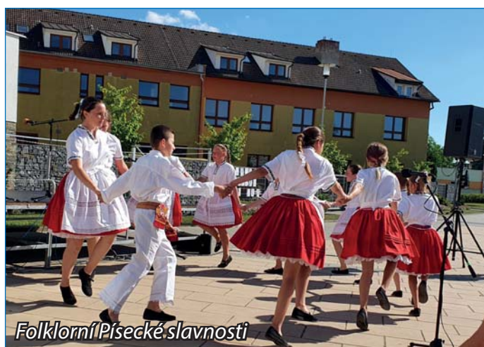
Folklorní Písecké slavnosti