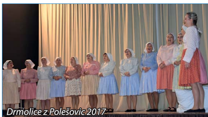
Drmolice z Polešovic 2017