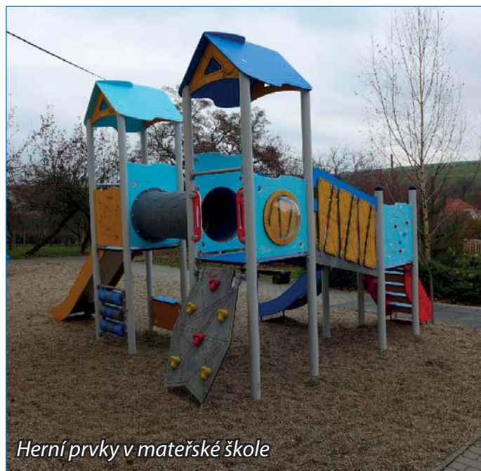
Herní prvky v mateřské škole

I v letošním školním roce jsou děti rozděleny na dvě třídy. Sovičky, kam chodí děti od 4 do 6 let a Lištičky, kam patří děti od 3 do 4 let. V rámci výchovně vzdělávací činnosti se dětem věnují 4 pedagogické pracovnice.