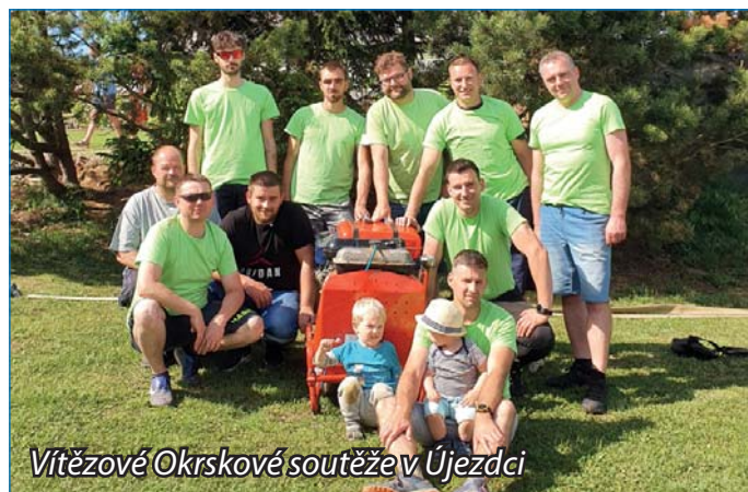
Vítězné Okrskové soutěže v Újezdci