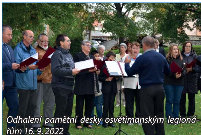
Odhalení pamětní desky osvětimanským legionářům 16. 9. 2022