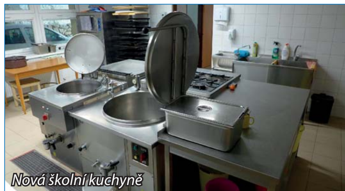
Nová školní kuchyně

Vážení občané, chceme poděkovat městysovi Osvětimany, našemu zřizovateli, od kterého škola dostala dva krásné dárky. Ten první byl pro nás už po několik let pouhým přáním, skoro nespelnitelným. Ale podařilo se! Dlouho plánovaná rekonstrukce školní kuchyně a částečně jídelny nezůstala jenom vizí, ale stala se konečně skutečností. Práce byly náročné a musely probíhat v době hlavních prázdnin, za běžného chodu školy by to bylo nerealizovatelné. Jisté obavy byly, zda se vše stihne do začátku školního roku, ale nakonec vše dobře dopadlo a provoz školní kuchyně pro ZŠ a MŠ byl zahájen 5. 9. 2022. Nové prostředí je odměnou hlavně pro naše paní kuchařky, které pracovaly dlouhá léta v nevyhovujících podmínkách, a žáci zase oceňují zvětšení prostoru školní jídelny.