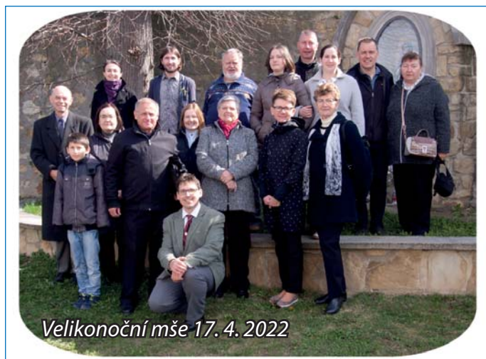
Velikonoční mše 17. 4. 2022