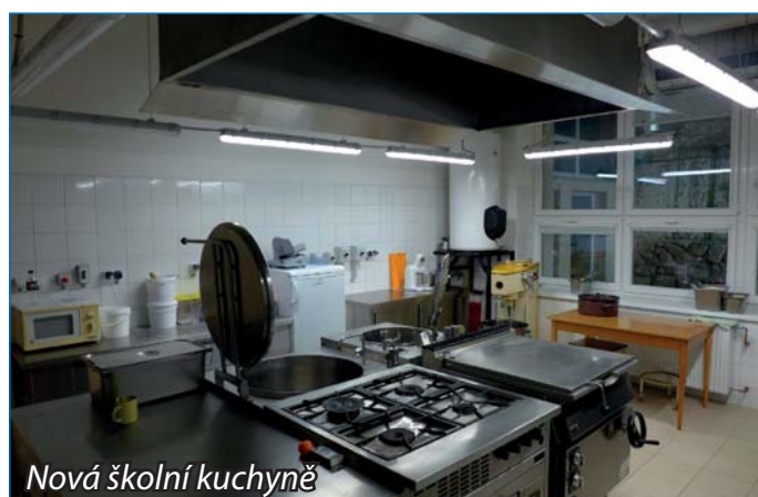
Nová školní kuchyně

Pojďme k druhému daru městyse, který přinesl potěšení hlavně našim dětem. Díky podpoře městyse Osvětimany se mohla uskutečnit další veřejná zakázka, jejímž předmětem byla výstavba nových herních prvků v prostoru okolí školy (zahrady základní školy a mateřské školy) včetně terénních úprav a vegetace za účelem obnovení a rozšíření dětského hřiště. Vyžití tu najdou naši žáci a děti z MŠ nejen k pohybovým aktivitám, pracovním činnostem – vyvýšené záhony k sázení, ale i ke vzdělávání, a to prostřednictvím naučných informačních tabulí, u kterých si mohou rozšiřovat poznatky například o třídění odpadů, o rostlinách, stromech a zvířatech. Ve školní zahradě se žáci učí vlastně v každém koutku, vnímají její proměny v ročních obdobích a vůbec v čase, protože je v ní pořád co k vidění. Ještě jednou děkujeme!