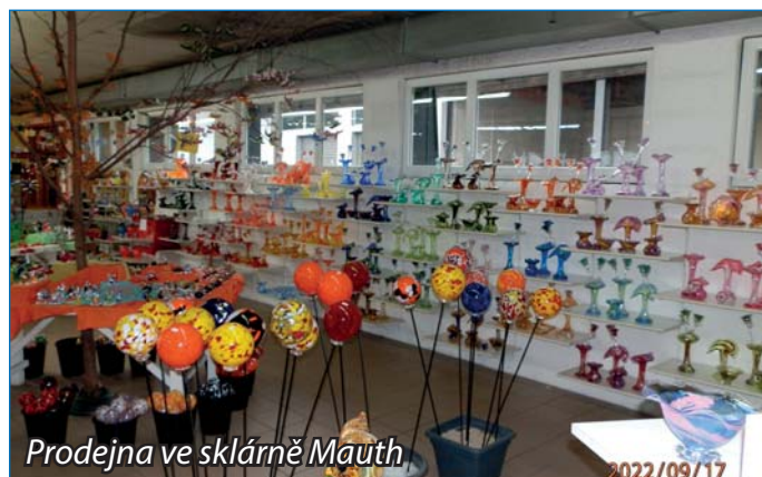
Prodejna ve sklárně Mauth