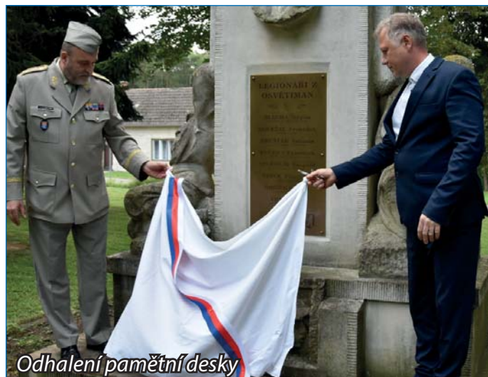
Odhalení pamětní desky