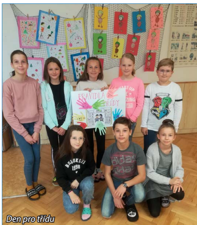
Den pro třídu

Na tyto a další otázky dal odpověď nový projekt s názvem Den pro třídu, do kterého se zapojili žáci 4. až 9. třídy. Pro žáky si třídní učitelé připravili různé zajímavé aktivity a hry na podporu dobrých vztahů ve třídě. Nabídky žákům možnost se lépe poznat, ostatní i samy sebe, podpořit respekt, empatii a důvěru mezi nimi. V některých třídách se žáci dohodli na nových pravidlech třídy a jejich dodržování. Jinde si navzájem upřímně řekli, co se jim líbí nebo naopak nelíbí na spolužácích. Učili se vhodným způsobem vyjádřit své připomínky vůči chování druhého člověka. Zaměřili jsme se také na řešení různých konfliktních situací s uplatněním tolerantního chování. Třídnický den splnil plánovaná očekávání a byl pozitivně přijat i žáky.