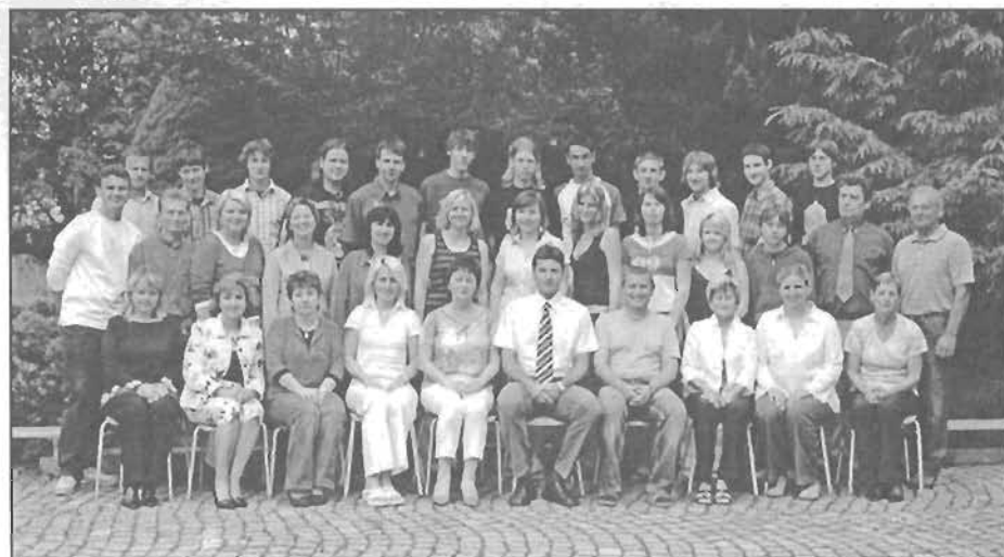
9. třída - Školní rok 2006-2007

6. února proběhl zápis dětí do prv- ního ročníku základní školy. K zá- pisu přišlo 22 dětí, sedm dětí dostalo odklad povinné školní docházky. Do prvního ročníku nastoupí tedy pouze 15 žáků.