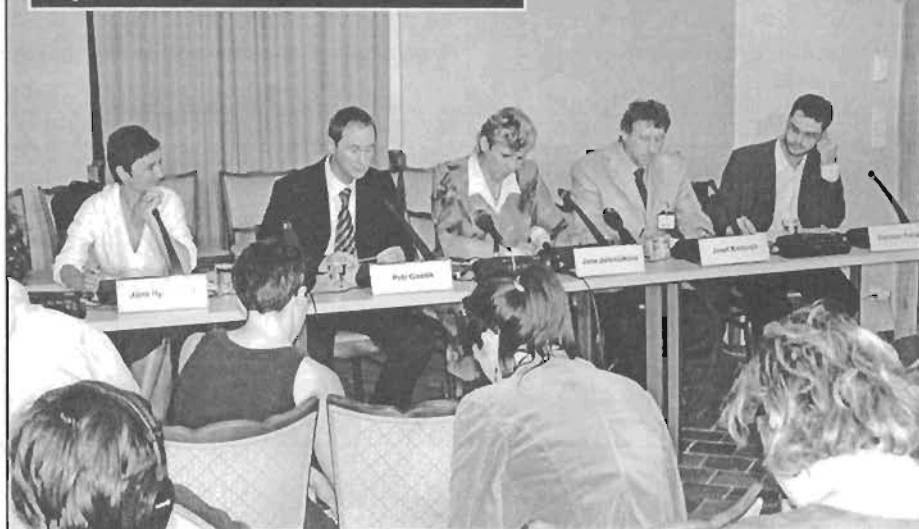
V senátu jsme na tiskové konferenci představili vlastní návrh zákona

Asi se ptáte, co tato moje práce přinese Osvětimanům. Prvních praktických výsledků jsme již dosáhli. Výchozí stav byl ten, že se menším obcím měly příjmy snižovat, aby byly nuceny se spojit. Navíc měla být zrušena daň ze zemědělských pozemků, což by přineslo našemu obecnímu rozpočtu další statisícové ztráty. Po tom, co se nám podařilo otevřít diskusi a na různých fórech uplatnit naše argumenty, jsme dnes dosáhli stavu, že vláda ustoupila od myšlenky zrušit daň ze zemědělských pozemků. O snížení financí obcím také již nikdo neuvažuje, naopak schválení vládního návrhu, jak je dnes koncipován, by mělo přinést našemu obecnímu rozpočtu půl milionu korun ročně navíc na úkor růstu příjmů velkých měst. My ale i nadále trváme na tom, aby dnešní živelné financování obcí a měst bylo napraveno zavedením adresného systémového řešení, které