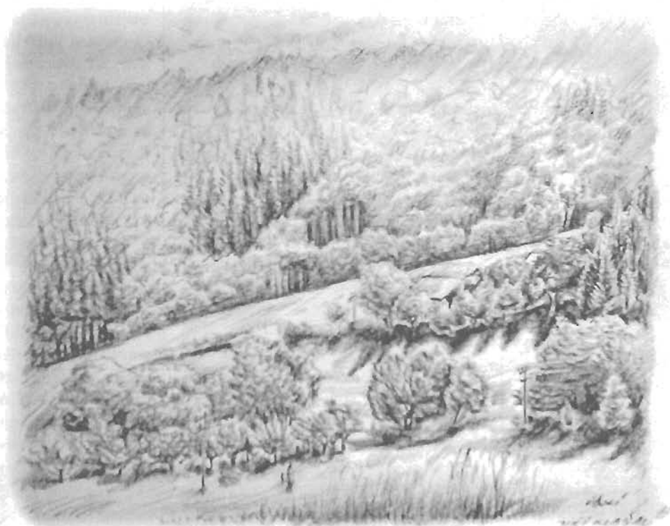
Svah na Dolních pasekách