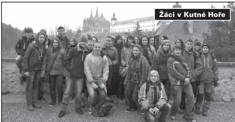
Žáci v Kutné Hoře

Klima školy vytvářejí společně žáci, učitelé a rodiče. Snažíme se vytvořit pro všechny prostředí otevřené, prostředí důvěry, bezpečí a spolupráce. Pedagogičtí pracovníci vzájemně spolupracují na školních projektech a akcích, vedou žáky k otevřené komunikaci a odpovědnosti. Třídy se účastní řady exkurzí, pracují na projektech s různým zaměřením, pořádají besedy, zájezdy do divadla, tematicky zaměřené akce. Rodiče mohou školu navštívit kdykoliv po vzájemné dohodě s vyučujícím, v době konzultačních hodin a tř. schůzek, při akcích pro veřejnost – dílničky, na informativní schůzce rodičů dětí budoucích prvňáčků.