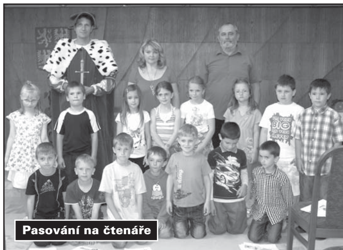
Pasování na čtenáře