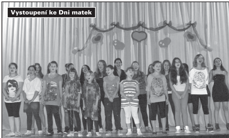
Vystoupení ke Dni matek

písníček, básniček a tanců. A přestože jsme se při nácvičce potýkali s velkou absencí žáků a na poslední chvíli za ně nacvičovaly záskoky, program se povedl a všem maminkám i ostatním divákům se velmi líbil.