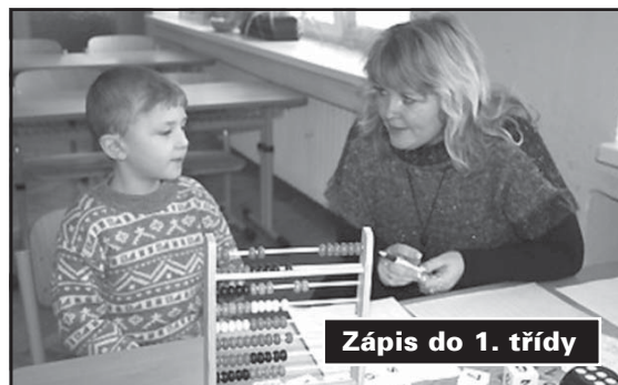
Zápis do 1. třídy

kabinetů je zasíťována, vyučující mají volný přístup k internetu, využívají tiskárnu a kopírku.