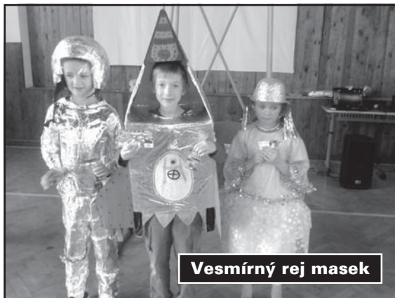
Vesmírný rej masek