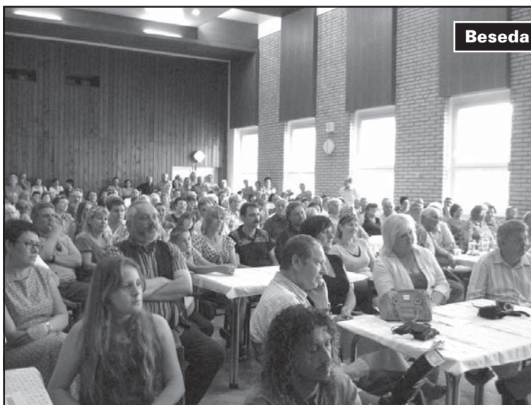
Beseda s občany

Po ukončení besedy odjel prezident Zeman na Koncert lidí dobré vůle na Velehrad.