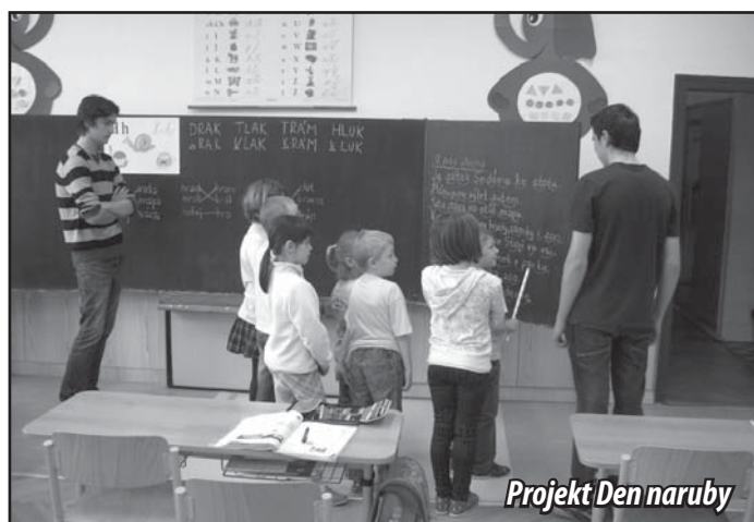
Projekt Den naruby

K výčtu významných školních akcí bychom mohli přičíst ještě Literární přehlídku družin, Den čarodějnic, projekt Den Země, exkurzi do Osvětimi, návštěvu čistíčky ve Bzenci, projekt Den naruby, projekt Kniha – můj kamarád se čtením pro děti v MŠ, besedu Lovecké právo, soutěž Zlatý list v Polešovicích, olympiády v zeměpise a anglickém jazyce, projekt První pomoc, sběr papíru, návštěvu ZOO v Hodoníně, filmové a divadelní představení, přírodovědnou soutěž v Polešovicích Zlatý list, třídní návštěvu na Filmovém festivalu ve Zlíně, dvě návštěvy Okresního soudu v Uh. Hradišti, kulturní vystoupení na Vánočním rozjímání a ke Dni matek, projekt Finanční svoboda, Den dětí, školní výlety a rozloučení s devátáky v tělocvičně a v obřadní síni OD v Osvětimanech. O některých z nich se můžete dovědět na našich webových stránkách.