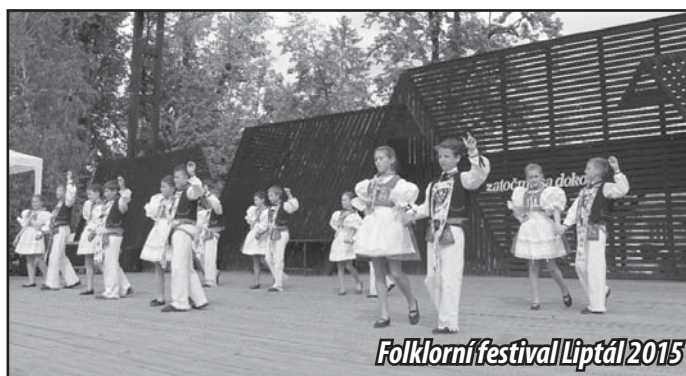
Folklorní festival Liptál 2015

Za Dětský folklorní soubor Klimentek Romana Pelikánová