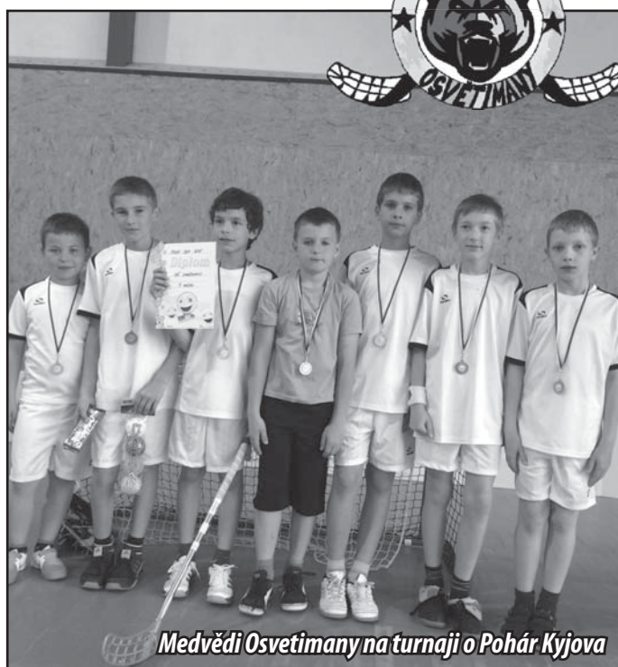
Medvědi Osvětimany na turnaji o Pohár Kyjova

Začátkem května (15. 5.) se žáci Osvětiman (elévové i přípravka) zúčastnili přátelských utkání na DDM v Kyjově, kde již získali silného soupeře v rámci části oddílu „Draci Kyjov“, kde se oběma kategoriím žáků Osvětimany podařilo jen těsně zvítězit. Díky tomu se však podařilo oddílu Osvětiman získat „divokou kartu“ na prestižní turnaj elévů