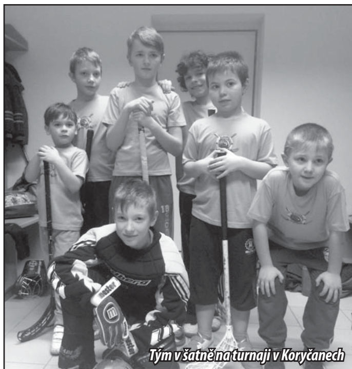
Tým v šatně na turnaji v Koryčanech