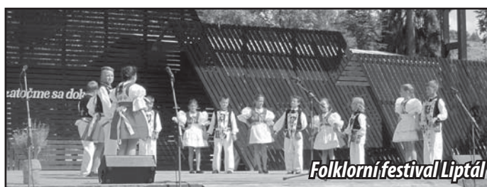
Folklorní festival Liptál