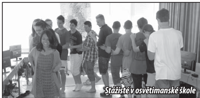
Stážisté v osvětimanské škole