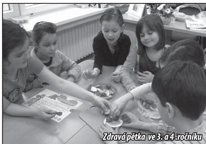
Zdravá pětka ve 3. a 4. ročníku