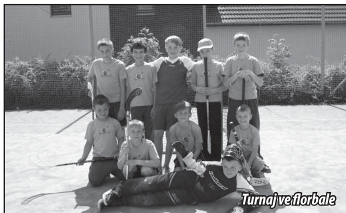
Turnaj ve florbale