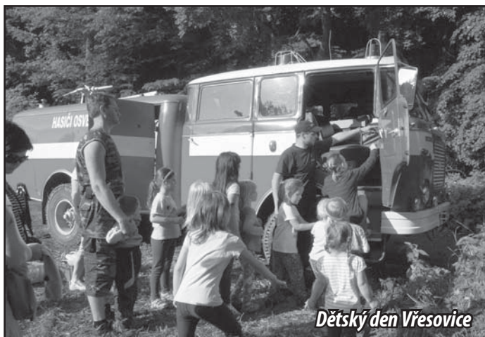
Dětský den Vřesovice

tak i, jak jsme se mylně domnívali, z důvodu zabezpečení proti „zlodějům“. Bohužel, jak jste si jistě všichni všimli, druhému důvodu stěhování se nezamezilo a banda mladých nenechavců, kteří pravděpodobně netuší kolik práce a starostí udržet tuto tradici stojí nám, máj pokácela i na náměstí. Ve spolupráci s našimi kamarády byla tato křivda do dvaceti hodin odčiněna a Osvětímány zdobily májky dvě – osvětimanská i žeravská.