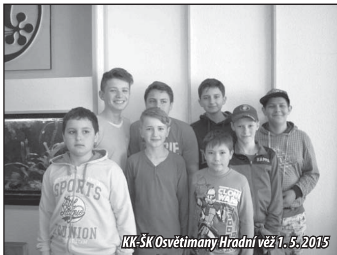
KK-ŠK Osvětímany Hradní věž 1. 5. 2015