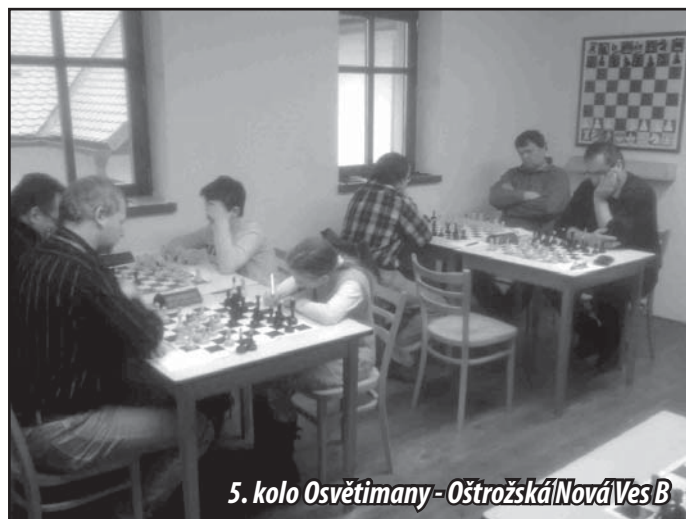
5. kolo Osvětlimany - Ostrožská Nová Ves B

V neděli 1. 3. 2015 jsme uspořádali na ukončení šachové sezóny turnaj pro hráče KK-ŠK Osvětlimany. Na turnaj byli také pozváni naši žáci, někteří se už zapojili i do soutěže mužů. Bohužel někteří hráči se turnaje nemohli zúčastnit z pracovních a jiných důvodů. Celkový