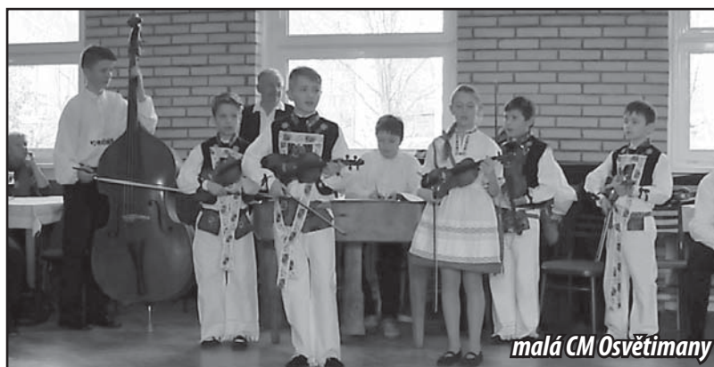
malá CM Osvětímány