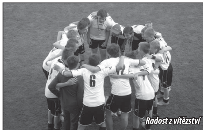
Radost z vítězství