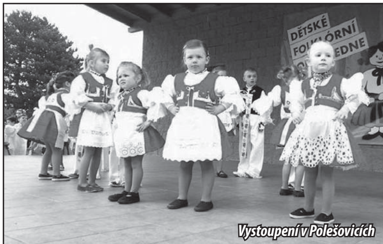
Vystoupení v Polešovicích