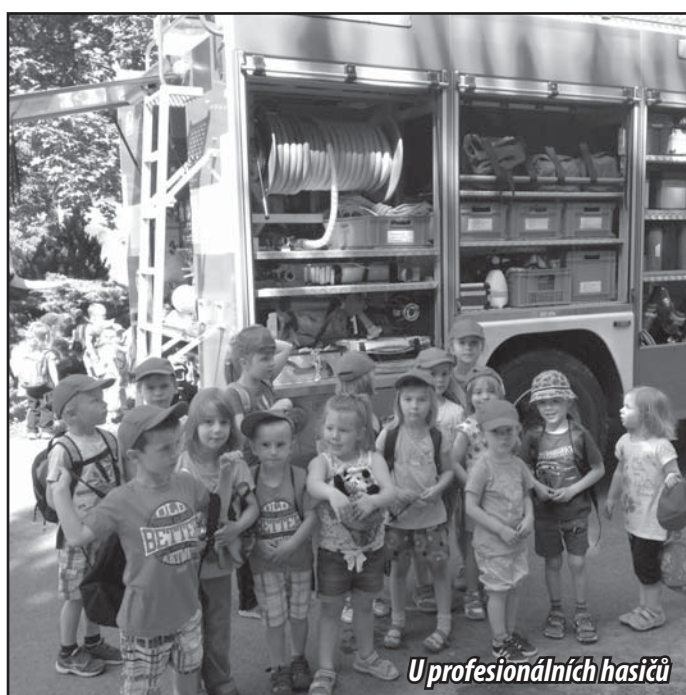
U profesionálních hasičů