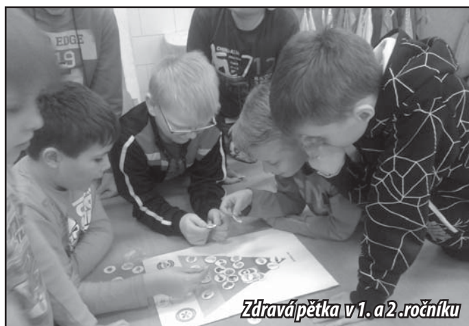
Zdravá pětka v 1. a 2. ročníku