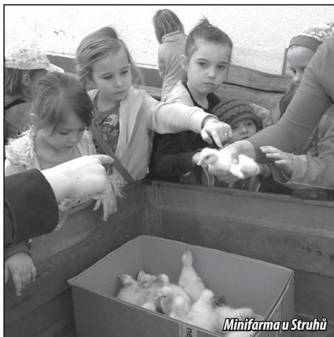
Minifarma u Struhů