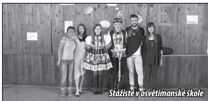
Stážisté v osvětimanské škole