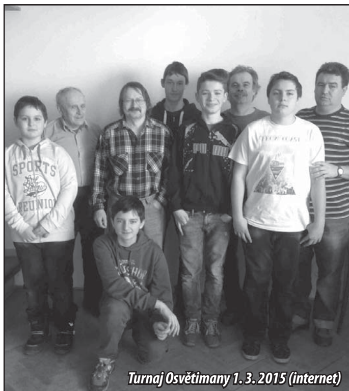
Turnaj Osvětímány 1. 3. 2015