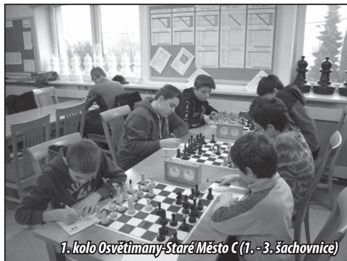
1. kolo Osvětímany-Staré Město C (1.-3. šachovnice)