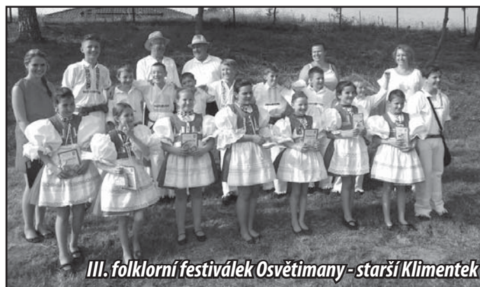
III. folklorní festivalček Osvětímány - starší Klimentek