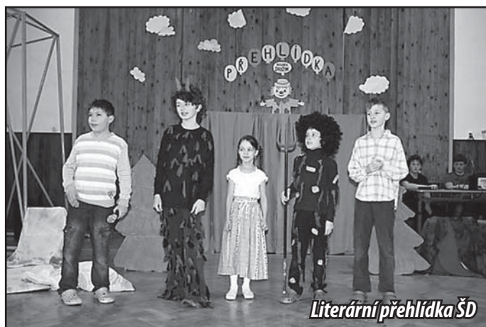
Literární přehlídka ŠD

Jak ten čas letí! Není tomu tak dávno, kdy jsme vítali mezi nás nové prvňáčky. Dopsali jsme však už poslední stránky v třídní knize, a uzavřeli tak další školní rok. Žáci se konečně dočkali vysněných prázdnin, na které se tak netrpělivě těšili. Přejeme všem dětem krásné prázdniny, aby si odpočinuly a načerpaly nových sil do následujícího školního roku 2015/2016, pedagogům pak zaslouženou dovolenou plnou sluníčka. Na závěr chceme poděkovat městysu Osvětimany, rodičům a členům Sdružení rodičů za pomoc a podporu v našich aktivitách.