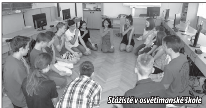
Stážisté v osvětimanské škole