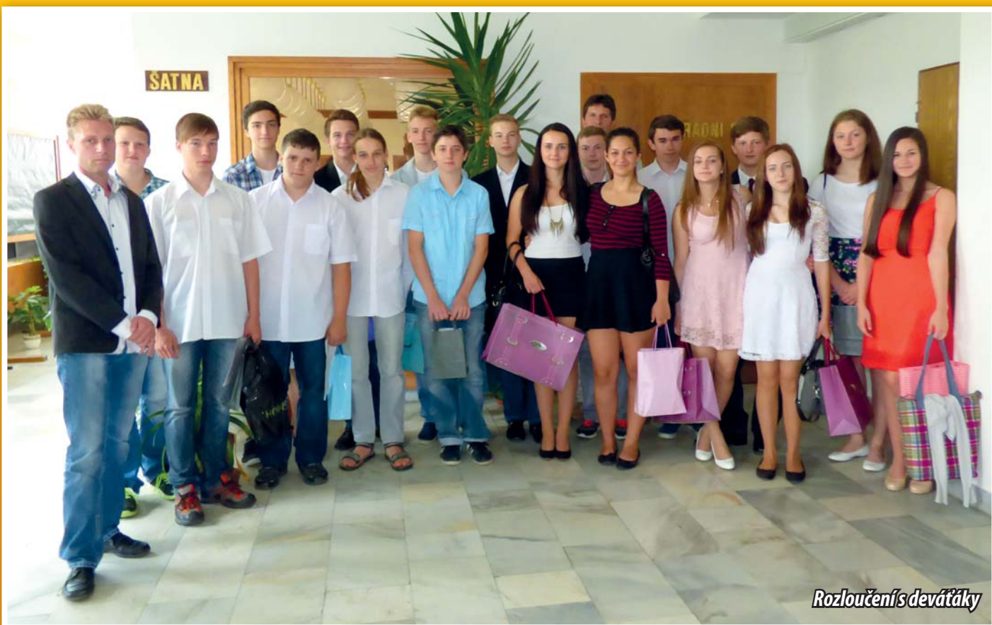
Rozloučení s devátáky