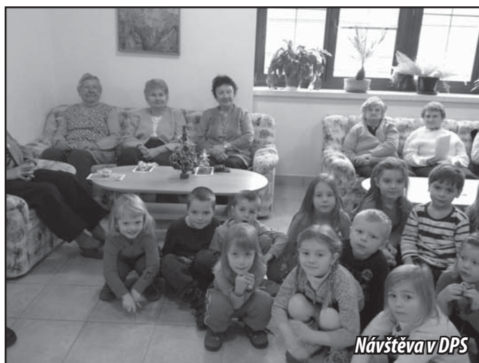
Návštěva v DPS